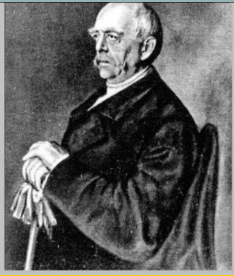
Отто фон Бисмарк