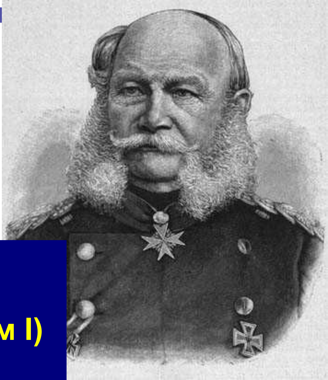
(кайзер Вильгельм I)