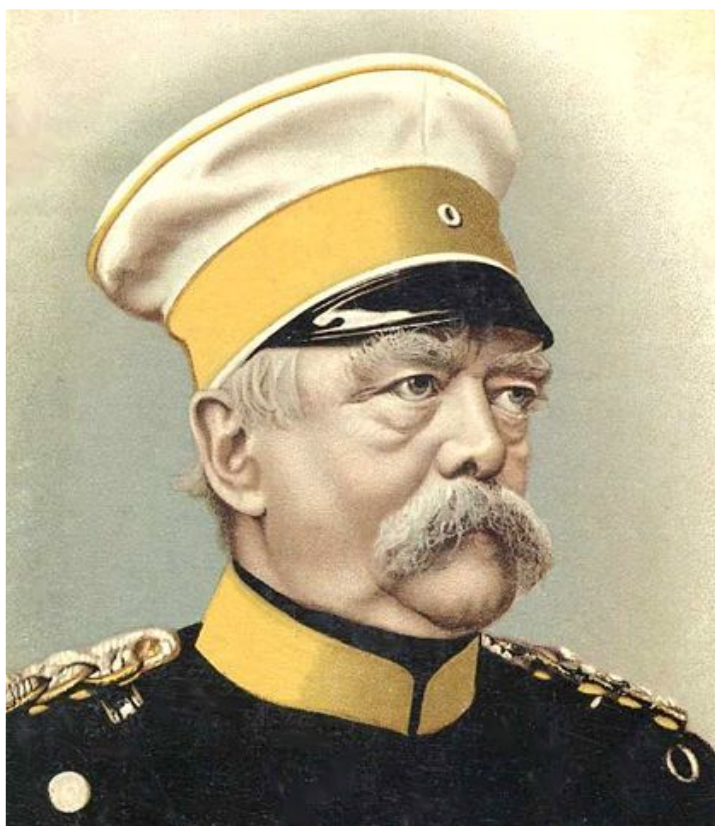
Отто фон Бисмарк