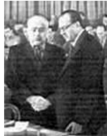
Первый президент ГДР О. Гротеволь и В.Пик

провозглашение создания Германской Демократической Республики на территории Восточной Германии.