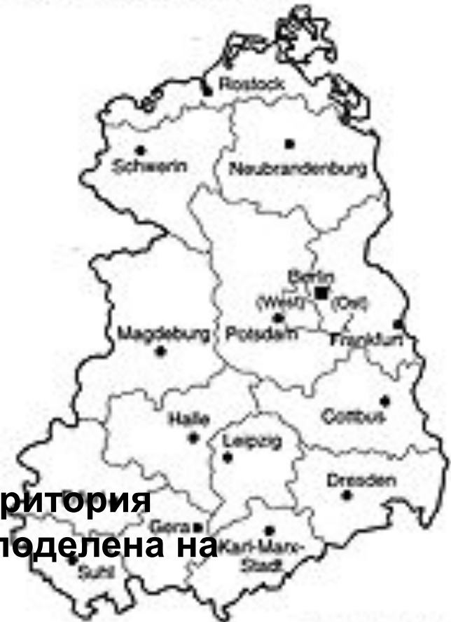
Gliederung der DDR Bezirksgrenzen (seit 1952)

В 1952г территория ФРГ была поделена на округа.