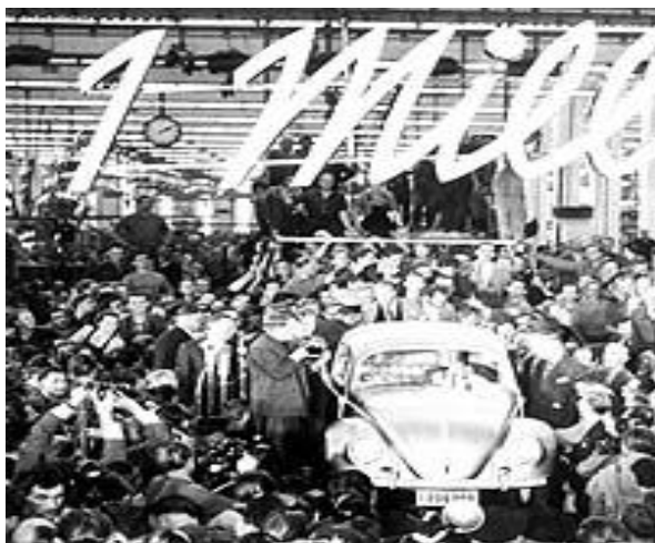
Миллионный «Фольксваген – жук», 1955г.