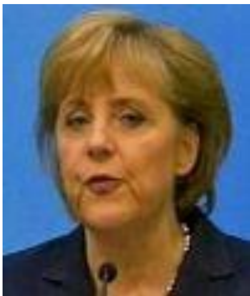
Ангела Меркель, Федеральный Канцлер Германии с 2005г.

В наши дни, Германия - одна из наиболее развитых держав мира. По уровню экономического и промышленного развития германия занимает 3е место в мире. Самой огромной проблемой страны на протяжении более чем 50-и лет остается высокий уровень безработицы, «тормозящий» развитие экономики.