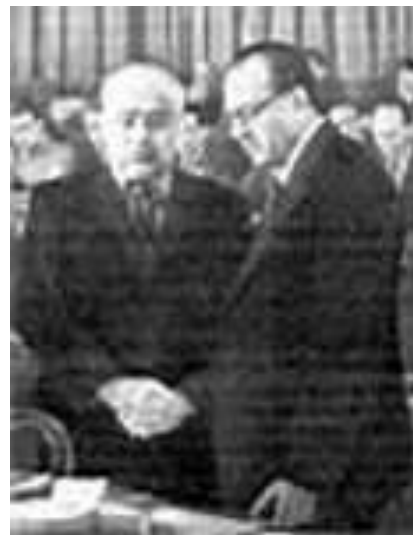
Первый президент ГДР О. Гротеволь и В.Пик

7 октября 1949г. – провозглашение создания Германской Демократической Республики на территории Восточной Германии.