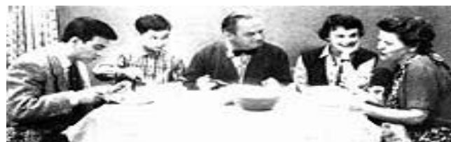
Первый немецкий сериал «Семейство Шелерман», 1954г.