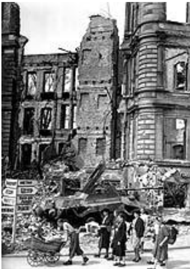
Берлин, лето 1945г.