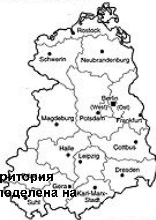
Gliederung der DDR Bezirksgrenzen (seit 1952)

В 1952г территория ФРГ была поделена на округа.