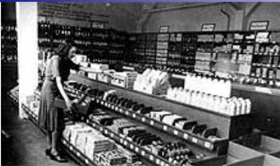
Первый магазин самообслуживания, Аугсбург, 1949г.