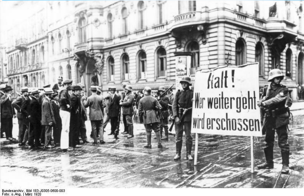
März 1920

Капповский путч в марте 1920 года стал для республики первым серьёзным испытанием на прочность.