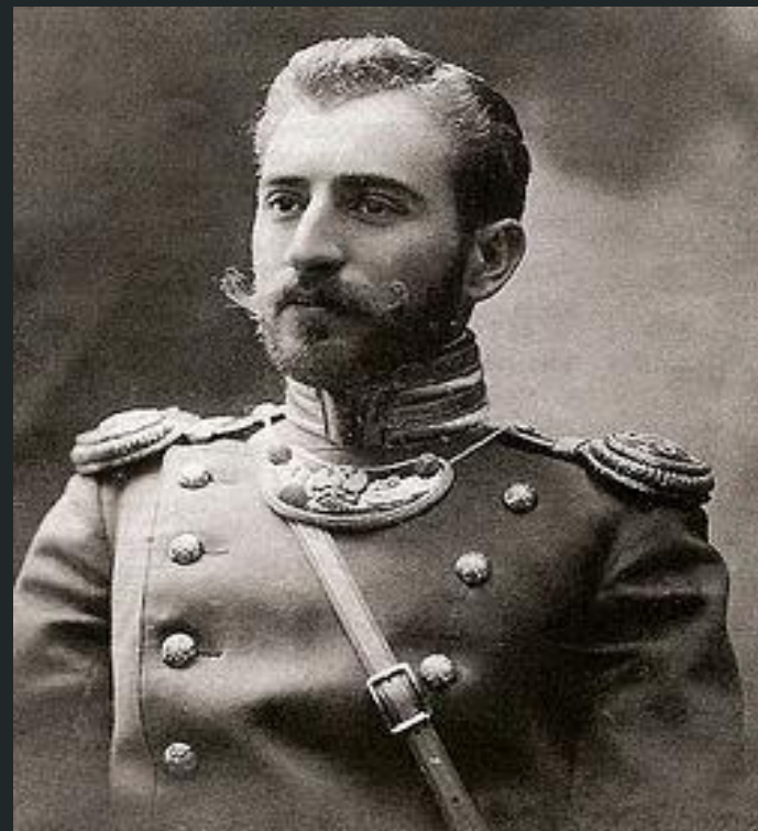
Пётр Фёдорович Болбочан