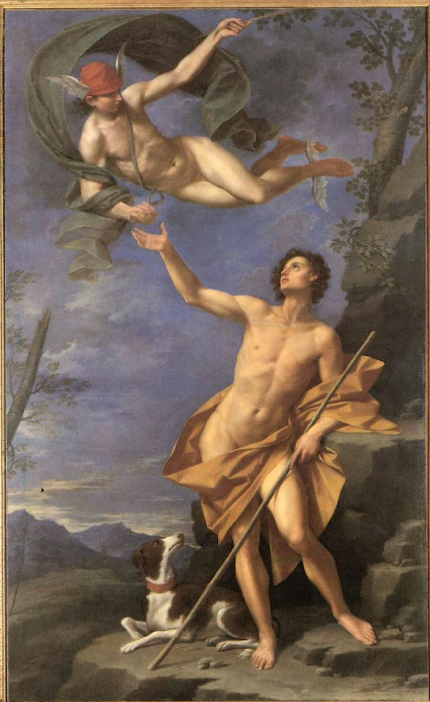
Гермес и Парис. Автор - Donato Creti, 1745