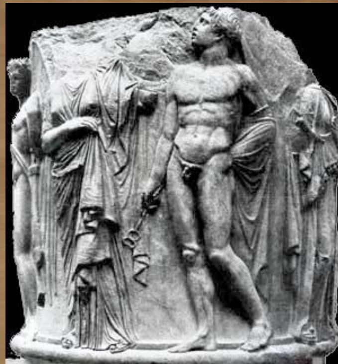
Барельеф, изображающий Гермеса и кариатид.