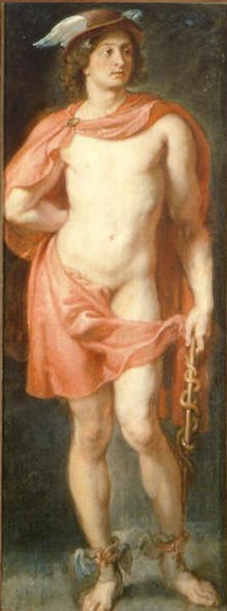
Гермес. Автор - Peter Paul Rubens