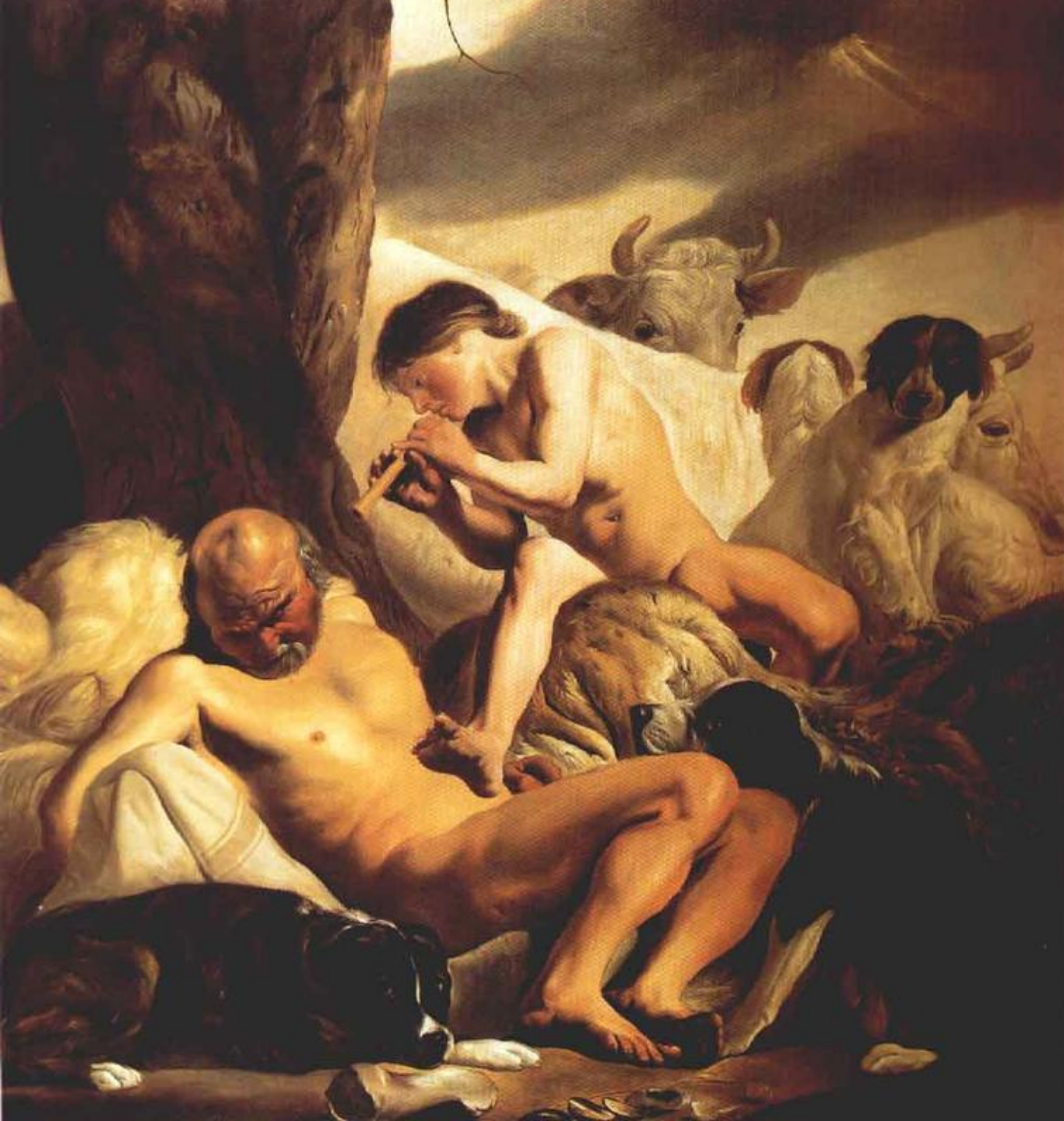
Гермес, Аргус и Ио. Автор - Якоб ван Сампен, 1630 гг