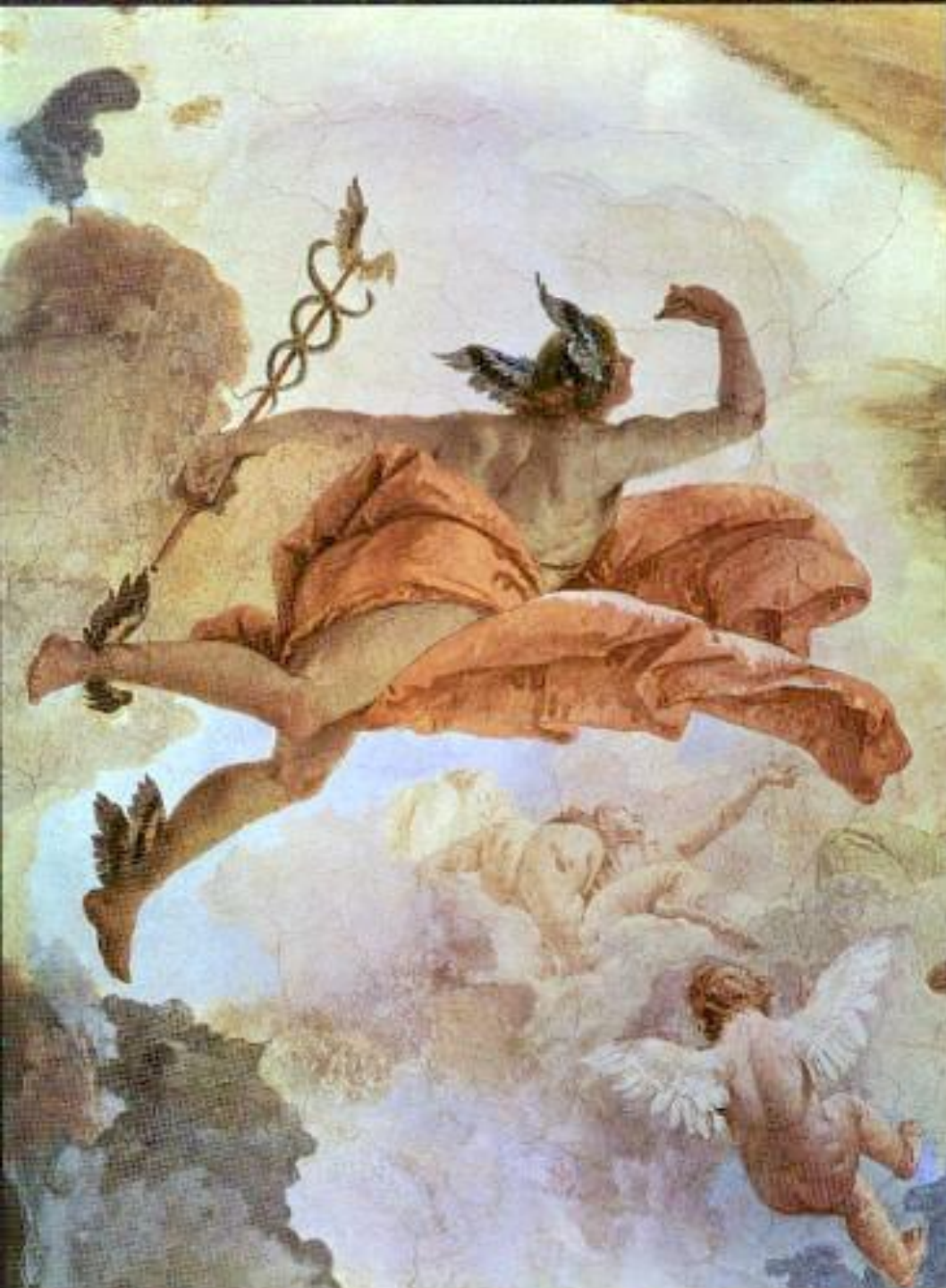
Гермес. Автор - Giambattista Tiepolo, фреска.