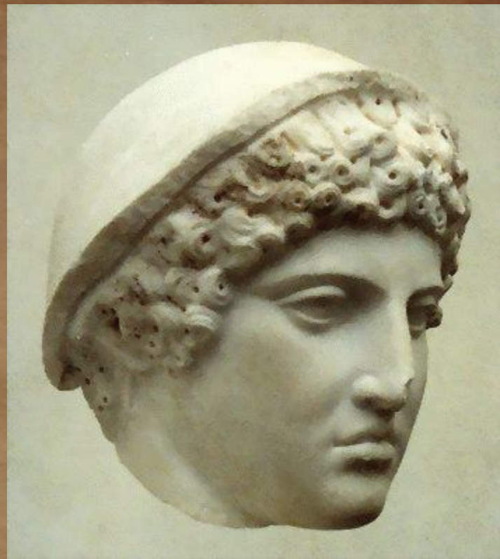
Гермес Лувовизи. Голова скульптуры. Римская копия 2 в. с греческого оригинала 5 в. до н.э.