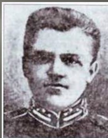
Аверкій Гончаренко, командуючий боєм під Крутами.