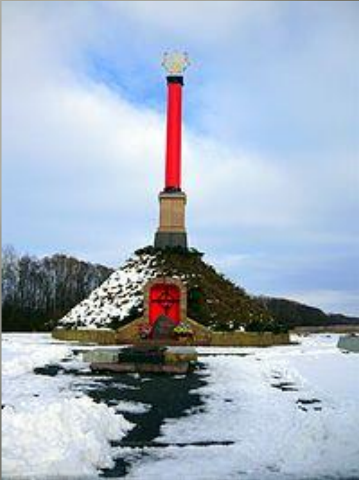
Монумент битви під Крутами

Тут береже Україна вічний сон молодих своїх синів, які загинули героїською смертю в боротьбі за її волю під Крутами 29 січня 1918 року