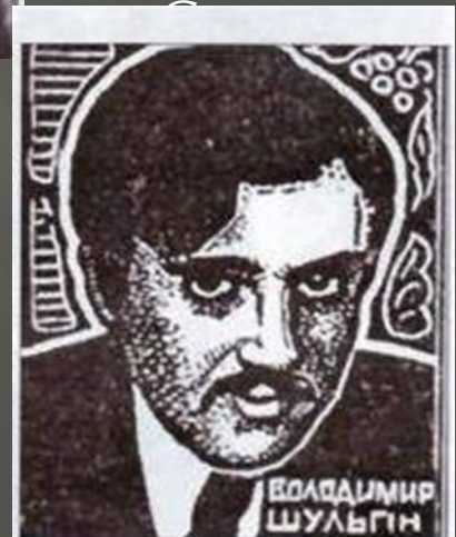
Володимир Шульгин, загинув у бою під Крутами.