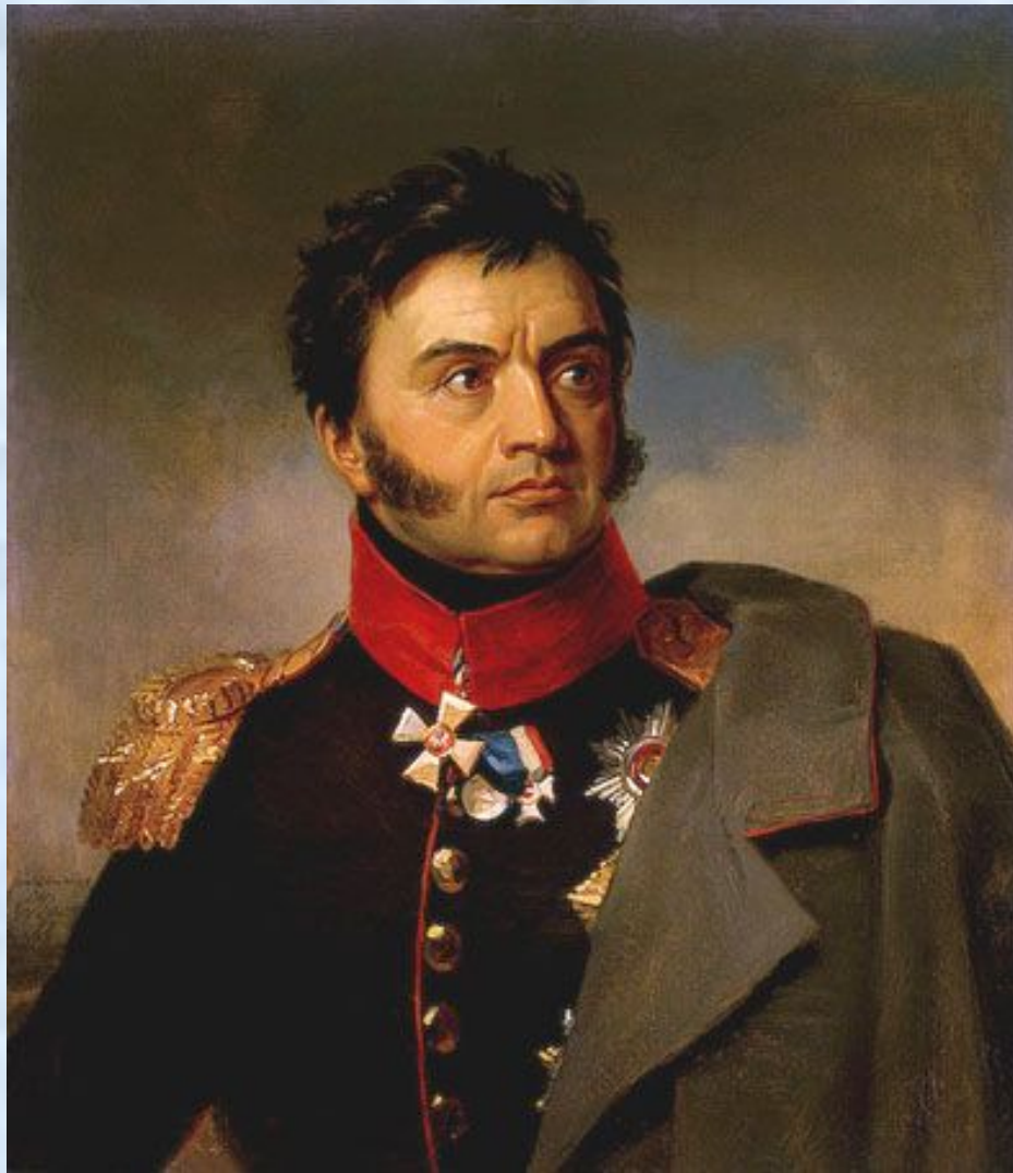
Николай Николаевич Раевский