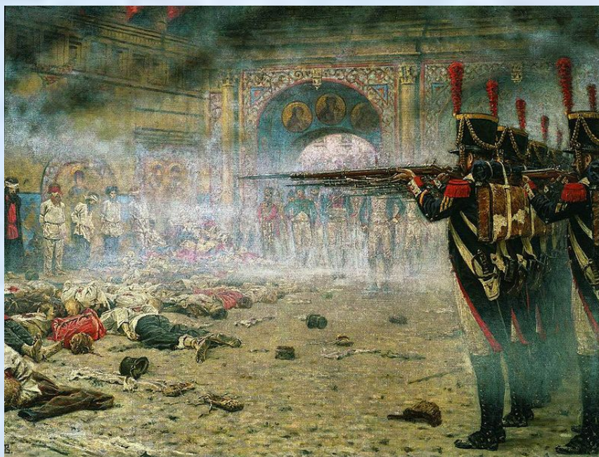
Расстрел предполагаемых поджигателей Москвы французами. Верещагин (1898)

В Отечественную войну она участвовала в сражениях под Смоленском, Колоцким монастырем, при Бородине, где была контужена в ногу, и уехала для лечения в Сарапул. В мае 1813 г. она снова появилась в действующей армии и приняла участие в войне за освобождение Германии, отличившись при блокаде крепости Модлина и города Гамбурга. Только в 1816 г., уступая просьбам отца, она вышла в отставку с чином штаб-ротмистра и пенсионом и жила то в Сарапуле, то в Елабуге. В 1836г. Дурова издала свою автобиографию под заглавием "Записки кавалерист-девицы", при посредстве и поддержке Пушкина, напечатавшего отрывки из этих записок в своем "Современнике" и рекомендовавшего их публике. Скончалась в 1866 г.