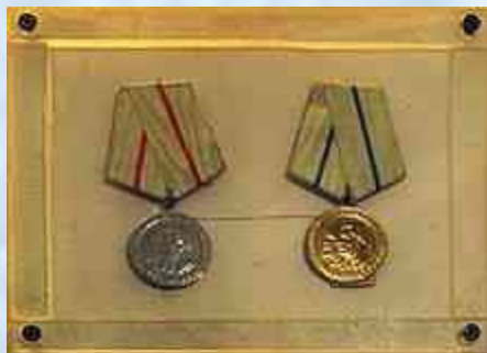
Медаль «Партизану Отечественной войны» I и II степени (Военно-исторический музей артиллерии, инженерных войск и войск связи, Санкт-Петербург)

Во всех партизанских вылазках проявляется храбрость Чеченского. 28 сентября 1812 года при освобождении села Ляхово русские воины под командованием Александра Чеченского взяли в плен 2 тысячи рядовых, 60 офицеров и одного генерала. За взятие Гродно без кровопролития Чеченскому был присвоен чин майора. В начале 1813 года Чеченский осадил Дрезден. Город сдался ему без боя. Давыдов доносил в своем рапорте: «...Чеченский отличился, это его привычка». А потом были сражения за Рейхенбаум, Бауцен, Люцин, Оснабрюк, Делич, Толх... Полк Чеченского участвовал в исторической «битве народов» под Лейпцигом. За сражение под Лионом с 70 тысячной армией Наполеона Александр Чеченский был награжден орденом Святой Анны с бриллиантами. После взятия Парижа полковник Чеченский в свите царя участвует в торжественном параде на Елисейских полях. Грудь полковника украшали серебряные медали «За вступление в Париж» и «В память 1812 года».