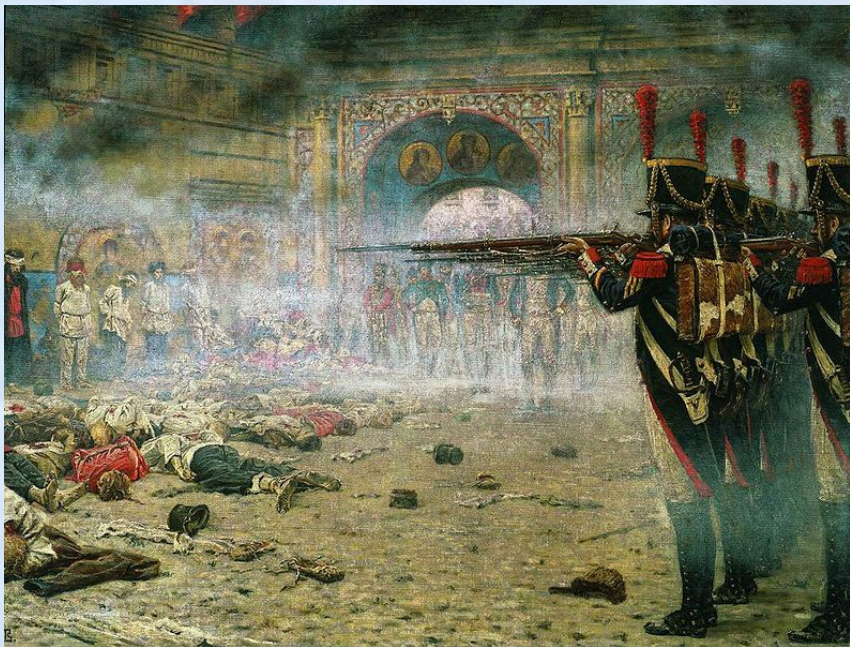
Расстрел предполагаемых поджигателей Москвы французами. Верещагин (1898)

В Отечественную войну она участвовала в сражениях под Смоленском, Колоцким монастырем, при Бородине, где была контужена в ногу, и уехала для лечения в Сарапул. В мае 1813 г. она снова появилась в действующей армии и приняла участие в войне за освобождение Германии, отличившись при блокаде крепости Модлина и города Гамбурга. Только в 1816 г., уступая просьбам отца, она вышла в отставку с чином штаб-ротмистра и пенсионом и жила то в Сарапуле, то в Елабуге. В 1836г. Дурова издала свою автобиографию под заглавием "Записки кавалерист-девицы", при посредстве и поддержке Пушкина, напечатавшего отрывки из этих записок в своем "Современнике" и рекомендовавшего их публике. Скончалась в 1866 г.