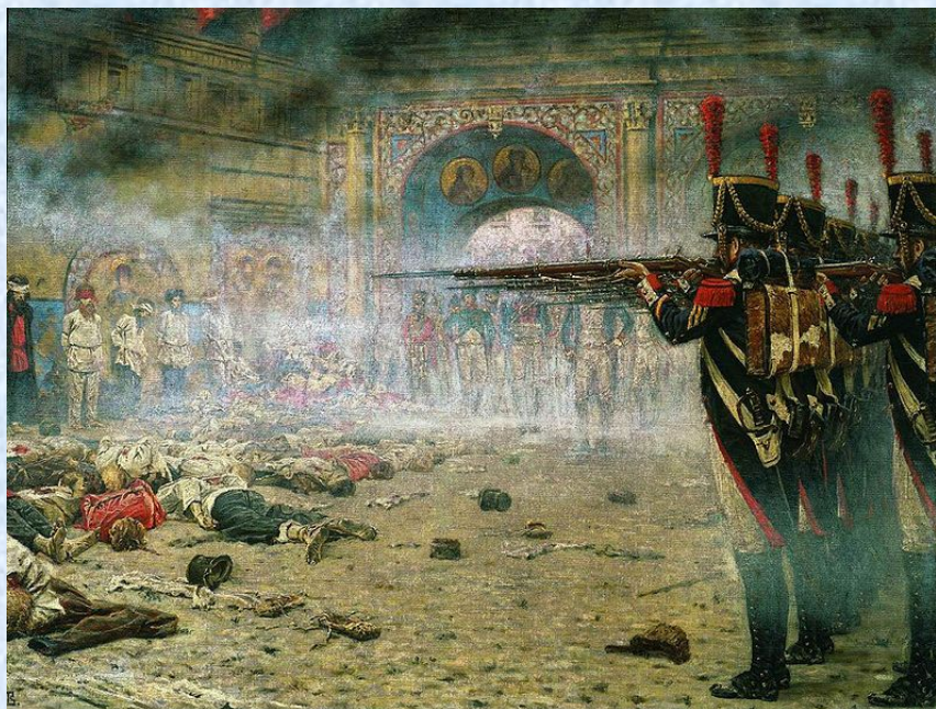
Расстрел предполагаемых поджигателей Москвы французами. Верещагин (1898)

В Отечественную войну она участвовала в сражениях под Смоленском, Колоцким монастырем, при Бородине, где была контужена в ногу, и уехала для лечения в Сарапул. В мае 1813 г. она снова появилась в действующей армии и приняла участие в войне за освобождение Германии, отличившись при блокаде крепости Модлина и города Гамбурга. Только в 1816 г., уступая просьбам отца, она вышла в отставку с чином штаб-ротмистра и пенсионом и жила то в Сарапуле, то в Елабуге. В 1836г. Дурова издала свою автобиографию под заглавием "Записки кавалерист-девицы", при посредстве и поддержке Пушкина, напечатавшего отрывки из этих записок в своем "Современнике" и рекомендовавшего их публике. Скончалась в 1866 г.