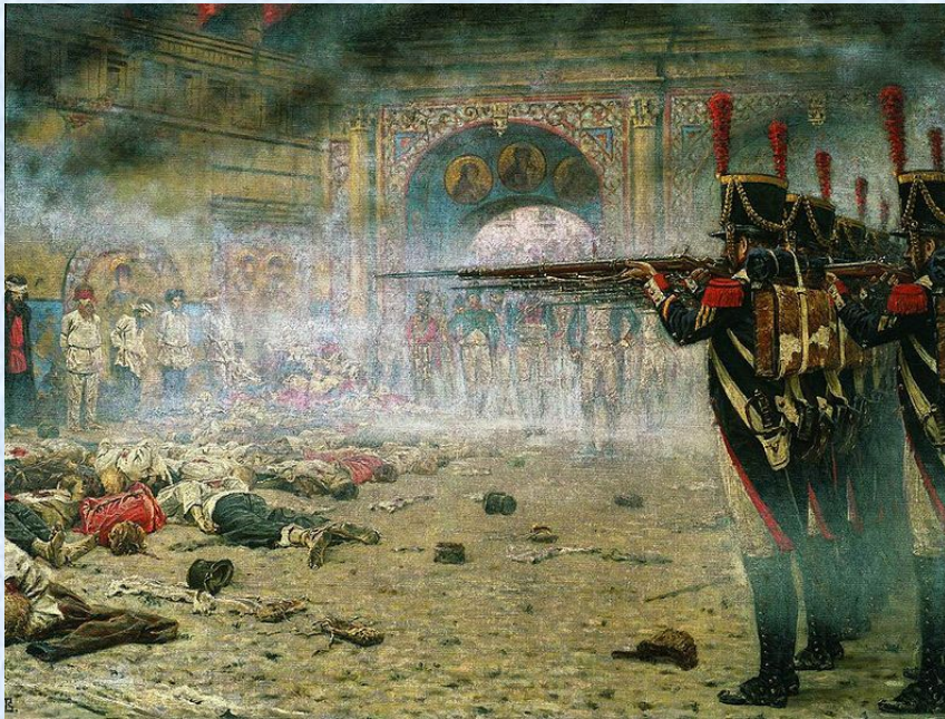
Расстрел предполагаемых поджигателей Москвы французами. Верещагин (1898)

В Отечественную войну она участвовала в сражениях под Смоленском, Колоцким монастырем, при Бородине, где была контужена в ногу, и уехала для лечения в Сарапул. В мае 1813 г. она снова появилась в действующей армии и приняла участие в войне за освобождение Германии, отличившись при блокаде крепости Модлина и города Гамбурга. Только в 1816 г., уступая просьбам отца, она вышла в отставку с чином штаб-ротмистра и пенсионом и жила то в Сарапуле, то в Елабуге. В 1836г. Дурова издала свою автобиографию под заглавием "Записки кавалерист-девицы", при посредстве и поддержке Пушкина, напечатавшего отрывки из этих записок в своем "Современнике" и рекомендовавшего их публике. Скончалась в 1866 г.