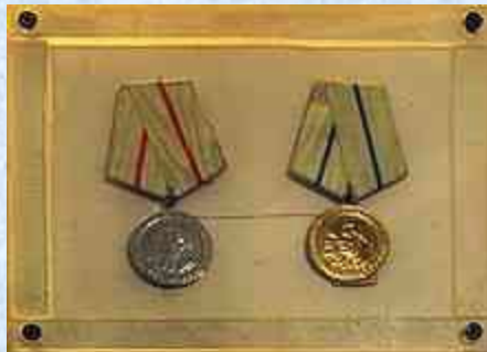
Медаль «Партизану Отечественной войны» I и II степени (Военно-исторический музей артиллерии, инженерных войск и войск связи, Санкт-Петербург)

Во всех партизанских вылазках проявляется храбрость Чеченского. 28 сентября 1812 года при освобождении села Ляхово русские воины под командованием Александра Чеченского взяли в плен 2 тысячи рядовых, 60 офицеров и одного генерала. За взятие Гродно без кровопролития Чеченскому был присвоен чин майора. В начале 1813 года Чеченский осадил Дрезден. Город сдался ему без боя. Давыдов доносил в своем рапорте: «...Чеченский отличился, это его привычка». А потом были сражения за Рейхенбаум, Бауцен, Люцин, Оснабрюк, Делич, Толх... Полк Чеченского участвовал в исторической «битве народов» под Лейпцигом. За сражение под Лионом с 70 тысячной армией Наполеона Александр Чеченский был награжден орденом Святой Анны с бриллиантами. После взятия Парижа полковник Чеченский в свите царя участвует в торжественном параде на Елисейских полях. Грудь полковника украшали серебряные медали «За вступление в Париж» и «В память 1812 года».