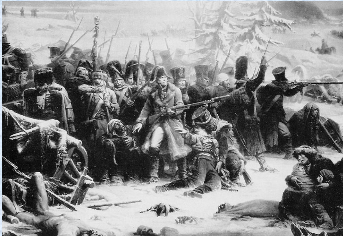
Французские солдаты маршала Нея загнаны в лес в сражении под Красным, худ. А. Ивон

Армейские партизанские отряды создавались преимущественно из казачьих войск и были неодинаковыми по своей численности: от 50 до 500 человек. Им ставились задачи смелыми и внезапными действиями в тылу противника уничтожать его живую силу, наносить удары по гарнизонам, подходящим резервам, выводить из строя транспорт, лишать врага возможности добывать себе продовольствие и фураж, следить за передвижением войск и доносить об этом в Главный штаб русской армии. Командирам партизанских отрядов указывалось основное направление действий и сообщались районы действий соседних отрядов на случай проведения совместных операций.