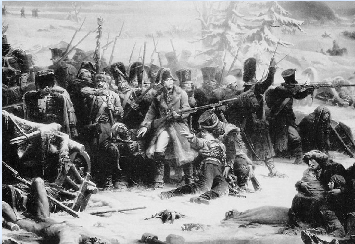
Французские солдаты маршала Нея загнаны в лес в сражении под Красным, худ. А. Ивон

Армейские партизанские отряды создавались преимущественно из казачьих войск и были неодинаковыми по своей численности: от 50 до 500 человек. Им ставились задачи смелыми и внезапными действиями в тылу противника уничтожать его живую силу, наносить удары по гарнизонам, подходящим резервам, выводить из строя транспорт, лишать врага возможности добывать себе продовольствие и фураж, следить за передвижением войск и доносить об этом в Главный штаб русской армии. Командирам партизанских отрядов указывалось основное направление действий и сообщались районы действий соседних отрядов на случай проведения совместных операций.