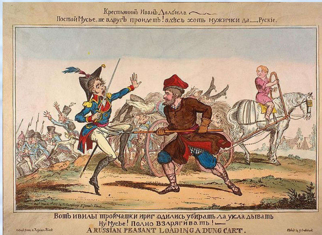
Война русского народа против французов в британской карикатуре 1813 года

Набрав небольшой отряд из охотников и отсталых солдат, Фигнер при содействии крестьян стал тревожить тыловые сообщения противника и своими отважными предприятиями навел такой страх, что голова его была оценена Наполеоном. Однако все старания захватить Фигнера остались бесплодными; несколько раз окруженный противником, он успевал спастись. Когда началось отступление французов, Фигнер вместе с Сеславиным отбил у них целый транспорт с драгоценностями, награбленными в столице.