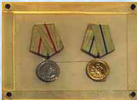
Медаль «Партизану Отечественной войны» I и II степени (Военно-исторический музей артиллерии, инженерных войск и войск связи, Санкт-Петербург)

Во всех партизанских вылазках проявляется храбрость Чеченского. 28 сентября 1812 года при освобождении села Ляхово русские воины под командованием Александра Чеченского взяли в плен 2 тысячи рядовых, 60 офицеров и одного генерала. За взятие Гродно без кровопролития Чеченскому был присвоен чин майора. В начале 1813 года Чеченский осадил Дрезден. Город сдался ему без боя. Давыдов доносил в своем рапорте: «...Чеченский отличился, это его привычка». А потом были сражения за Рейхенбаум, Бауцен, Люцин, Оснабрюк, Делич, Толх... Полк Чеченского участвовал в исторической «битве народов» под Лейпцигом. За сражение под Лионом с 70 тысячной армией Наполеона Александр Чеченский был награжден орденом Святой Анны с бриллиантами. После взятия Парижа полковник Чеченский в свите царя участвует в торжественном параде на Елисейских полях. Грудь полковника украшали серебряные медали «За вступление в Париж» и «В память 1812 года».