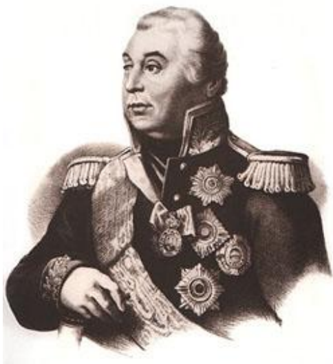
М.И.Кутузов на Бородинском поле