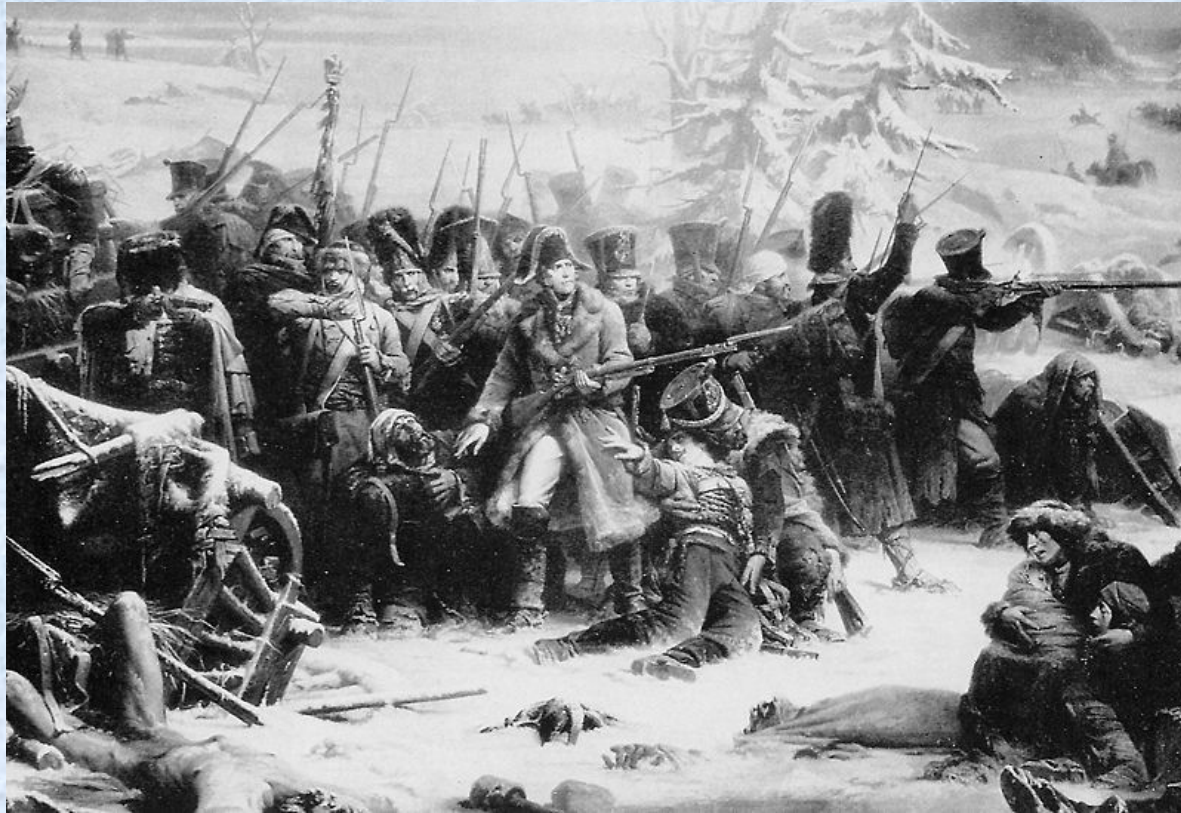
Французские солдаты маршала Нея загнаны в лес в сражении под Красным, худ. А. Ивон

Армейские партизанские отряды создавались преимущественно из казачьих войск и были неодинаковыми по своей численности: от 50 до 500 человек. Им ставились задачи смелыми и внезапными действиями в тылу противника уничтожать его живую силу, наносить удары по гарнизонам, подходящим резервам, выводить из строя транспорт, лишать врага возможности добывать себе продовольствие и фураж, следить за передвижением войск и доносить об этом в Главный штаб русской армии. Командирам партизанских отрядов указывалось основное направление действий и сообщались районы действий соседних отрядов на случай проведения совместных операций.