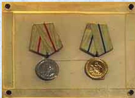
Медаль «Партизану Отечественной войны» I и II степени (Военно-исторический музей артиллерии, инженерных войск и войск связи, Санкт-Петербург)

Во всех партизанских вылазках проявляется храбрость Чеченского. 28 сентября 1812 года при освобождении села Ляхово русские воины под командованием Александра Чеченского взяли в плен 2 тысячи рядовых, 60 офицеров и одного генерала. За взятие Гродно без кровопролития Чеченскому был присвоен чин майора. В начале 1813 года Чеченский осадил Дрезден. Город сдался ему без боя. Давыдов доносил в своем рапорте: «...Чеченский отличился, это его привычка». А потом были сражения за Рейхенбаум, Бауцен, Люцин, Оснабрюк, Делич, Толх... Полк Чеченского участвовал в исторической «битве народов» под Лейпцигом. За сражение под Лионом с 70 тысячной армией Наполеона Александр Чеченский был награжден орденом Святой Анны с бриллиантами. После взятия Парижа полковник Чеченский в свите царя участвует в торжественном параде на Елисейских полях. Грудь полковника украшали серебряные медали «За вступление в Париж» и «В память 1812 года».