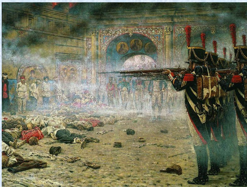
Расстрел предполагаемых поджигателей Москвы французами. Верещагин (1898)

В Отечественную войну она участвовала в сражениях под Смоленском, Колоцким монастырем, при Бородине, где была контужена в ногу, и уехала для лечения в Сарапул. В мае 1813 г. она снова появилась в действующей армии и приняла участие в войне за освобождение Германии, отличившись при блокаде крепости Модлина и города Гамбурга. Только в 1816 г., уступая просьбам отца, она вышла в отставку с чином штаб-ротмистра и пенсионом и жила то в Сарапуле, то в Елабуге. В 1836г. Дурова издала свою автобиографию под заглавием "Записки кавалерист-девицы", при посредстве и поддержке Пушкина, напечатавшего отрывки из этих записок в своем "Современнике" и рекомендовавшего их публике. Скончалась в 1866 г.