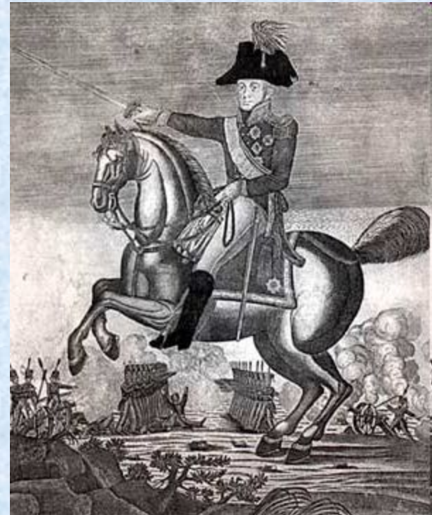
Барклай де Толли Михаил Богданович. Гравюра неизвестного автора. 1810-е гг.