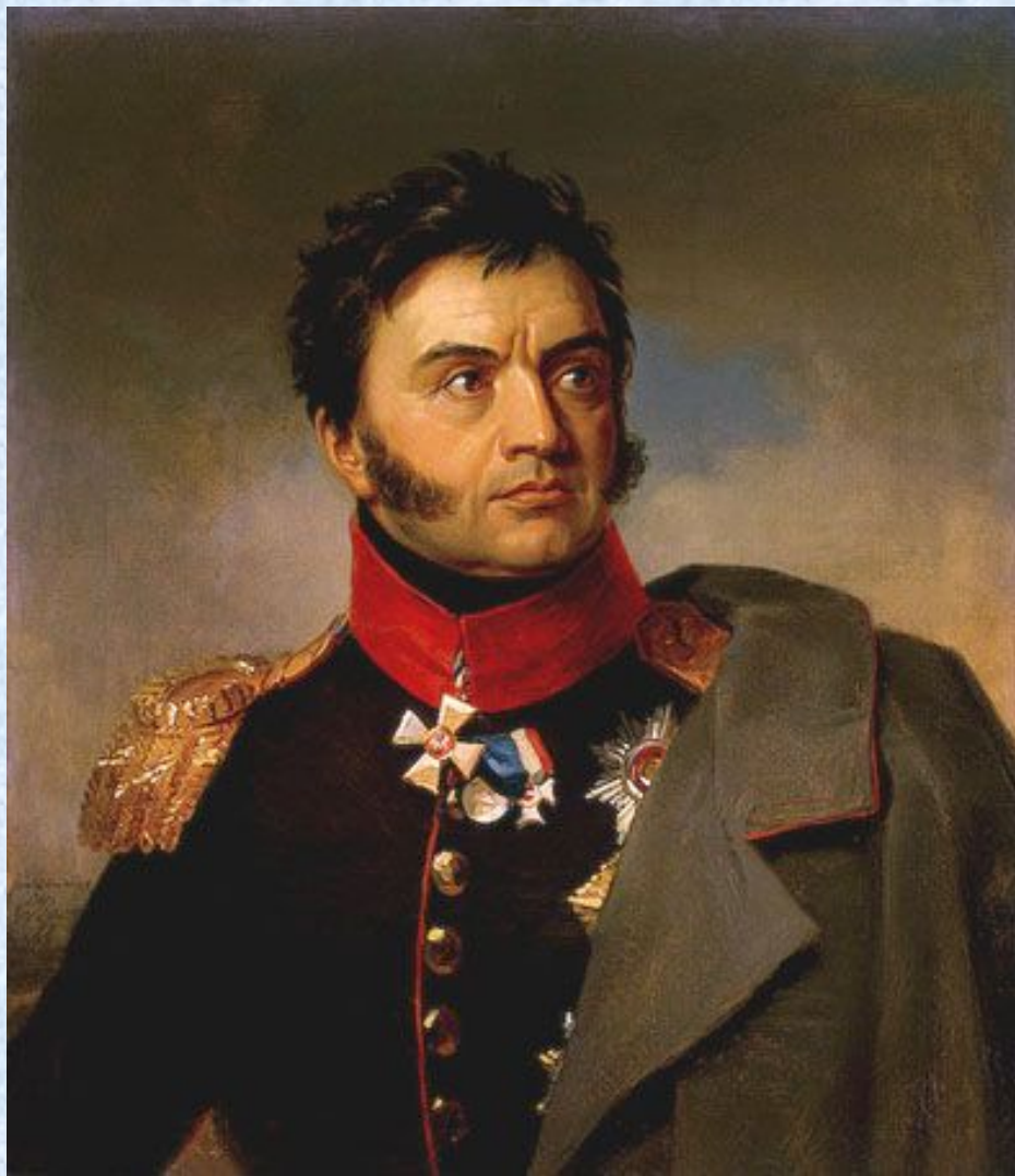
Николай Николаевич Раевский