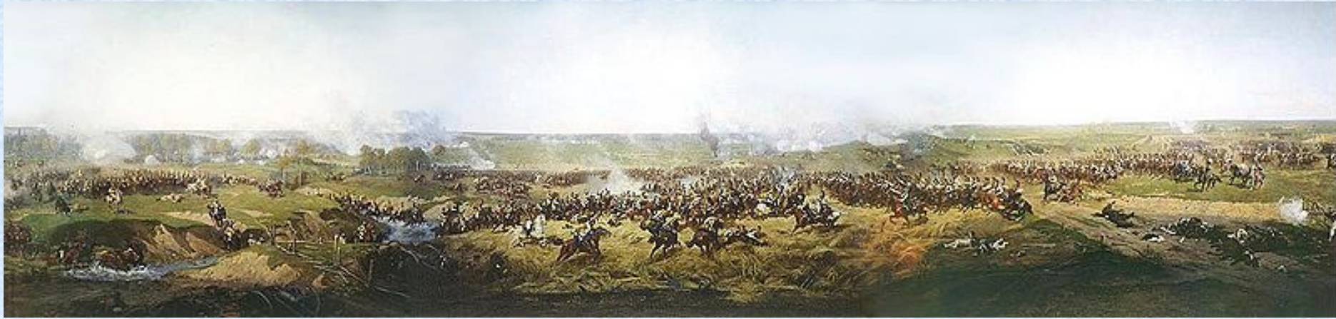
Атака русских кирасир под Бородиным. Фрагмент панорамы Бородинского сражения. Рубо (1912)