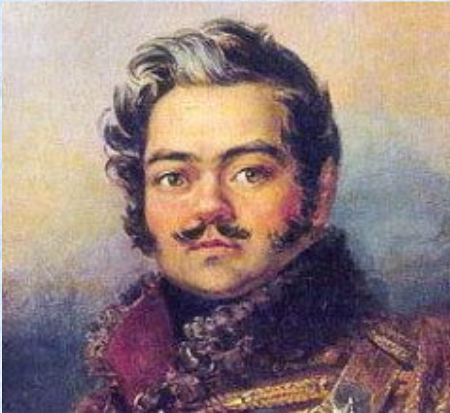
Поэт «Пушкинской плеяды», генерал-лейтенант, партизан Портрет Дениса Васильевича Давыдова мастерской Джорджа Доу. Военная галерея Зимнего Дворца, Государственный Эрмитаж (Санкт-Петербург)

A handwritten signature in cursive script, reading "Денис Васильевич Давыдов". The ink is dark and the background is a light, textured paper.