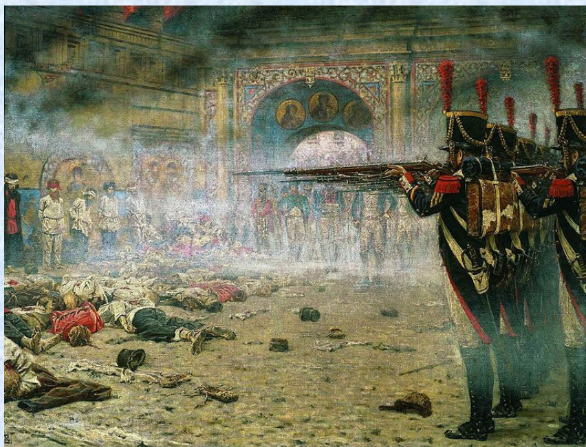
Расстрел предполагаемых поджигателей Москвы французами. Верещагин (1898)

В Отечественную войну она участвовала в сражениях под Смоленском, Колоцким монастырем, при Бородине, где была контужена в ногу, и уехала для лечения в Сарапул. В мае 1813 г. она снова появилась в действующей армии и приняла участие в войне за освобождение Германии, отличившись при блокаде крепости Модлина и города Гамбурга. Только в 1816 г., уступая просьбам отца, она вышла в отставку с чином штаб-ротмистра и пенсионом и жила то в Сарапуле, то в Елабуге. В 1836г. Дурова издала свою автобиографию под заглавием "Записки кавалерист-девицы", при посредстве и поддержке Пушкина, напечатавшего отрывки из этих записок в своем "Современнике" и рекомендовавшего их публике. Скончалась в 1866 г.