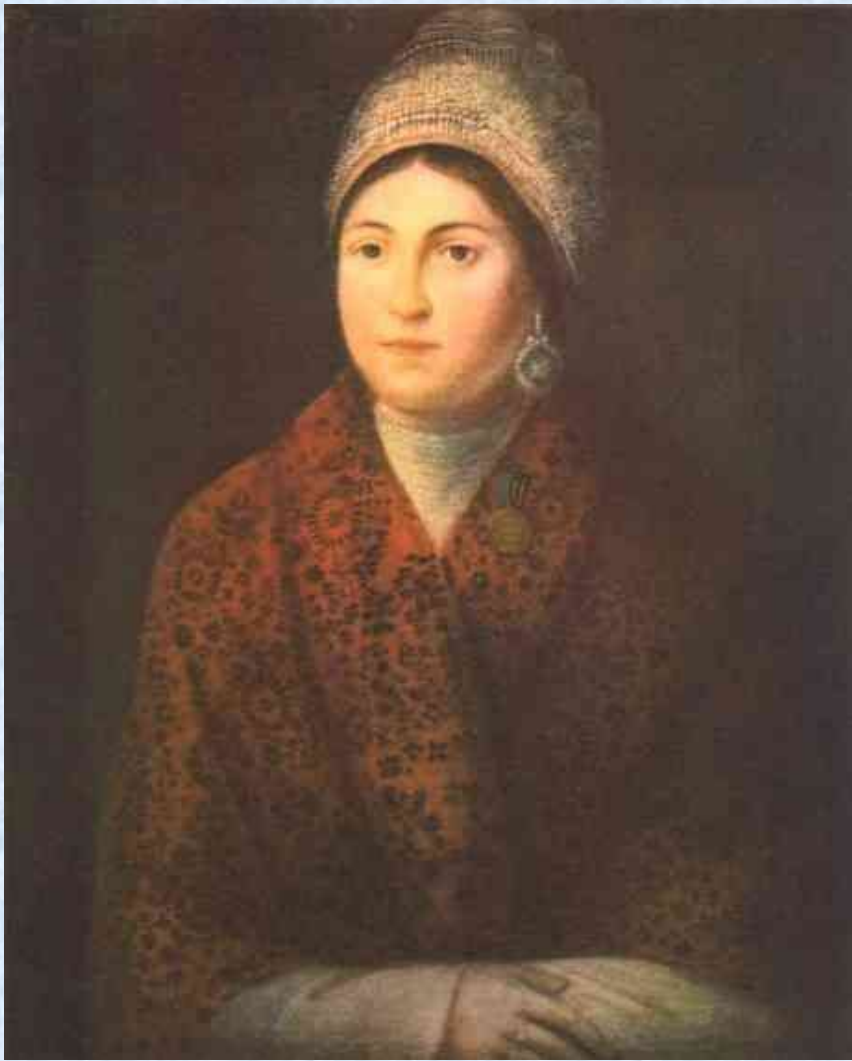
А. Смирнов. «Портрет Василисы Кожиной» (1813)