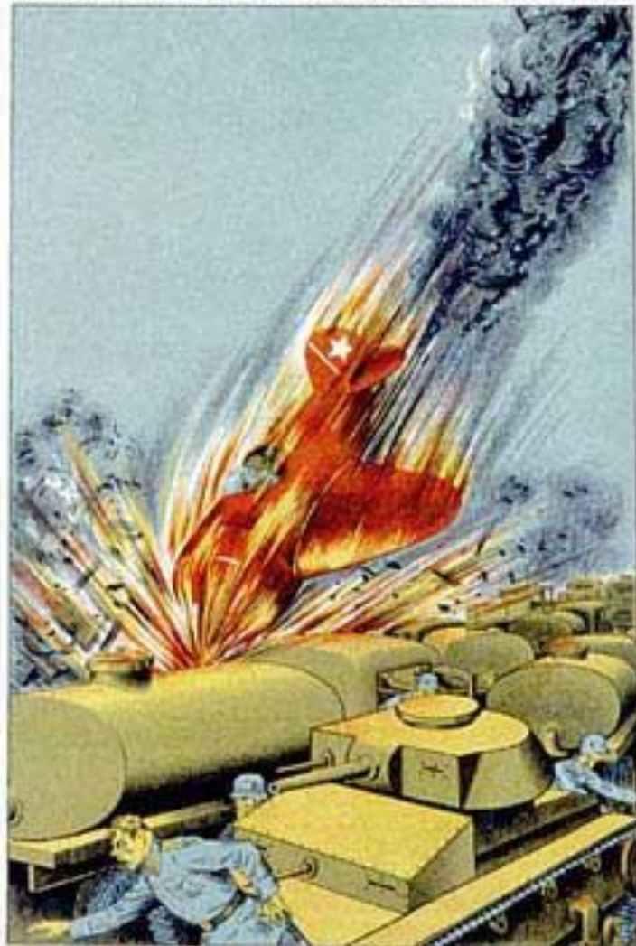
Следы войны несут в себя и Ленинград. Сам Герой Советского Союза капитан Н. Ф. Гастелло. Восточные оккупанты несли огромные потери в боях за Ленинград. Зениты не давали врагу сбить самолеты.