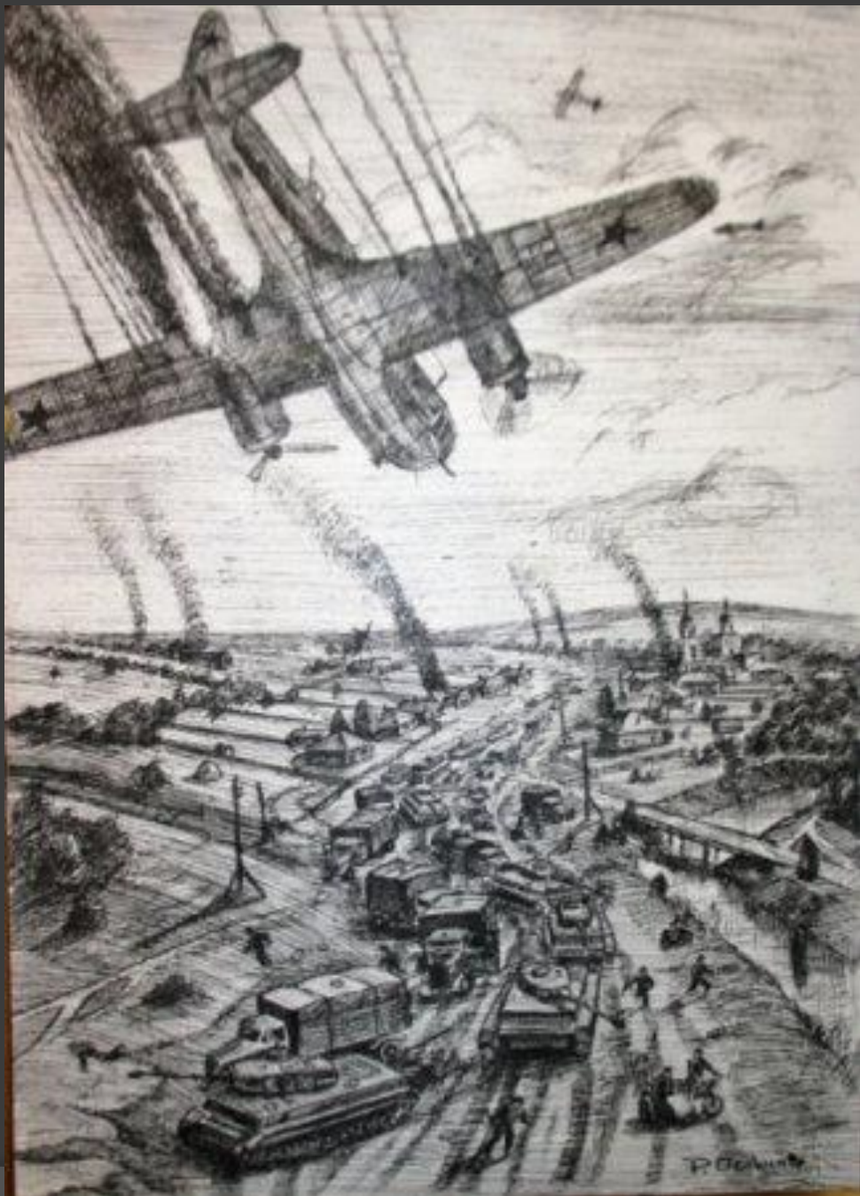
Бессмертный подвиг Героя Советского Союза капитана Н. Ф. Гастелло