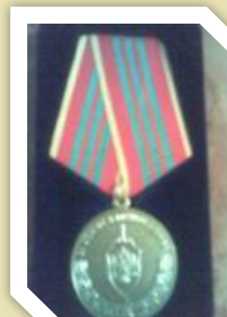
Награда «За отличие в военной службе». 2008 год