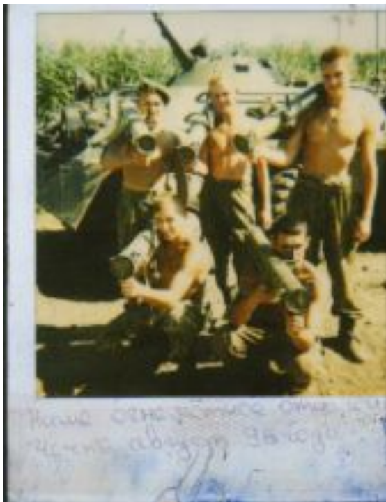
Огнемётное отделение. Чечня, август 1996 год