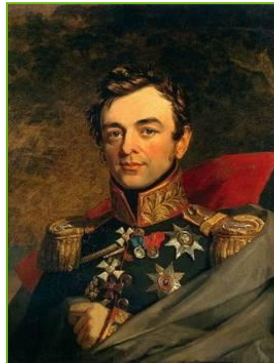
Иван Федорович Паскевич (1782 -1856)

Первый боевой поход Паскевич совершил в 1805 г., но настоящую боевую выучку получил во время русско-турецкой войны 1806 - 1812 гг. Он за пять лет прошел путь от капитана до генерал-майора. Паскевич был участником многих сражений этой войны, а в 1810 г. за овладение вражескими батареями на мысе Галотбург в ходе осады крепости Варны заслужил свой первый орден Святого Георгия четвертой степени.