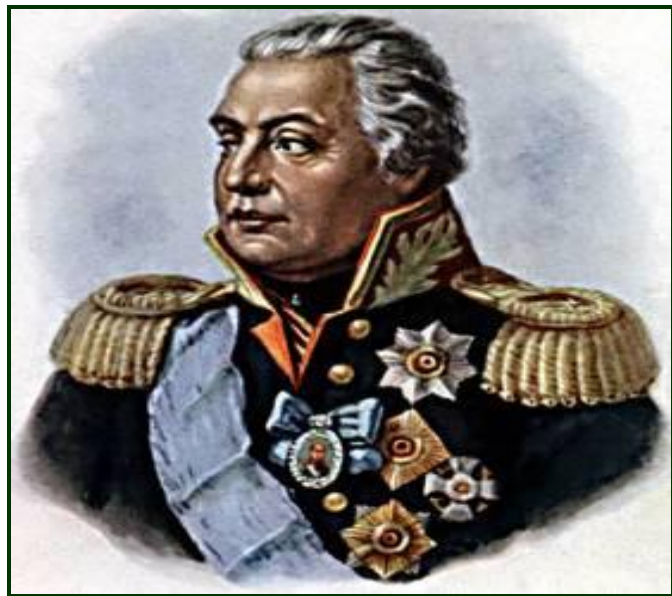
Михаил Илларионович Кутузов