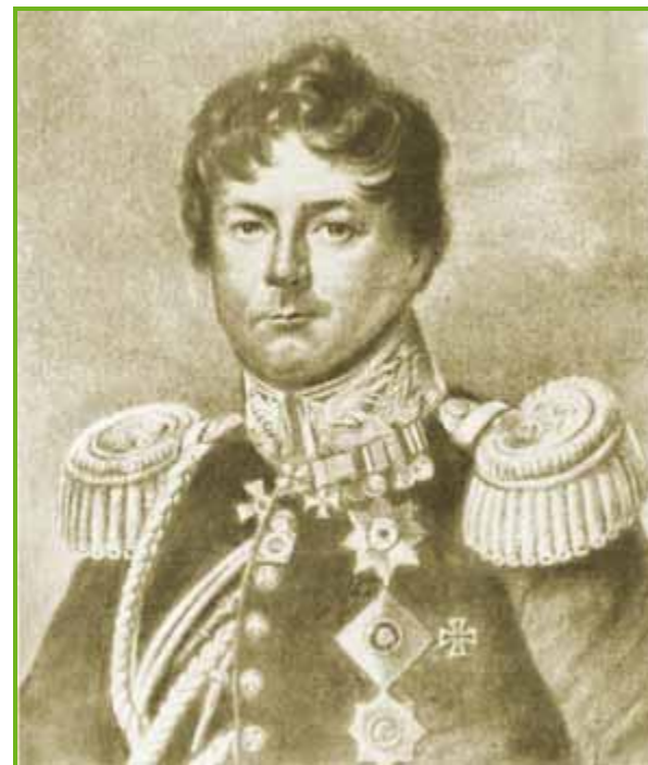
Иван Иванович Дибич-Забалканский (1785 - 1831)

Генерал-фельдмаршал, граф, участник войн с Францией 1805 - 1807 гг. и Отечественной войны 1812 г. Во время заграничного похода Русской армии 1813-1814 гг. - оберквартирмейстер корпуса, генерал-квартирмейстер армии и союзных русско-прусских войск. С 1815 г. - начальник штаба 1-й армии, с 1823 г. - начальник Главного штаба. В русско-турецкую войну 1828 - 1829 гг. - главнокомандующий Русской армией.