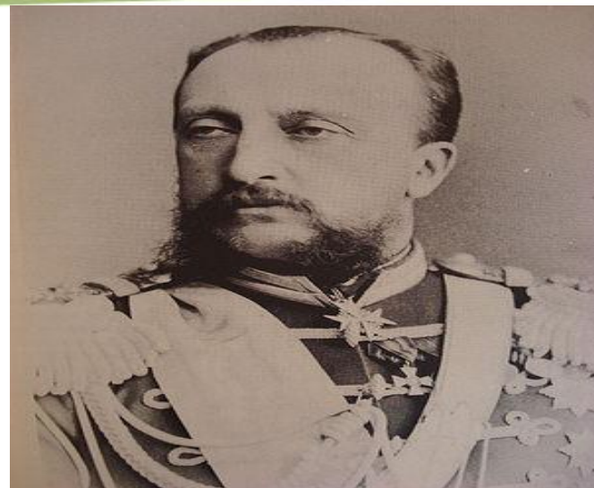
Великий князь Никола́й Никола́евич Ста́рший