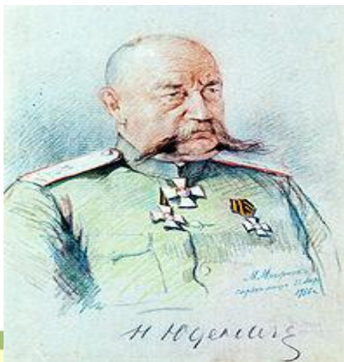
Генерал Н. Н. Юденич