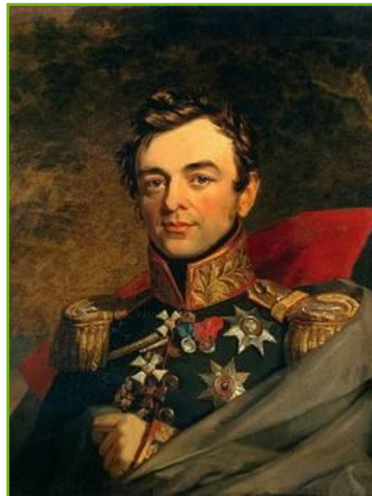
Иван Федорович Паскевич (1782 -1856)

Первый боевой поход Паскевич совершил в 1805 г., но настоящую боевую выучку получил во время русско-турецкой войны 1806 - 1812 гг. Он за пять лет прошел путь от капитана до генерал-майора. Паскевич был участником многих сражений этой войны, а в 1810 г. за овладение вражескими батареями на мысе Галотбург в ходе осады крепости Варны заслужил свой первый орден Святого Георгия четвертой степени.