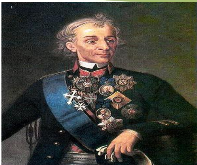
Алекса́ндр Васи́льевич Суво́ров