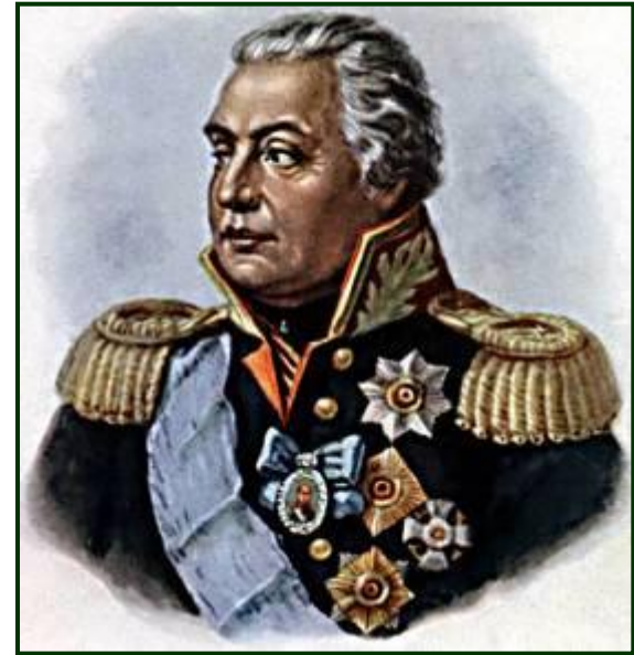
Михаил Илларионович Кутузов (1745 – 1813)

Он родился 5 сентября 1745 г. в Петербурге. В 1757 г. был определен в инженерно-артиллерийскую школу, а 1 января 1761 г. произведен в прапорщики.