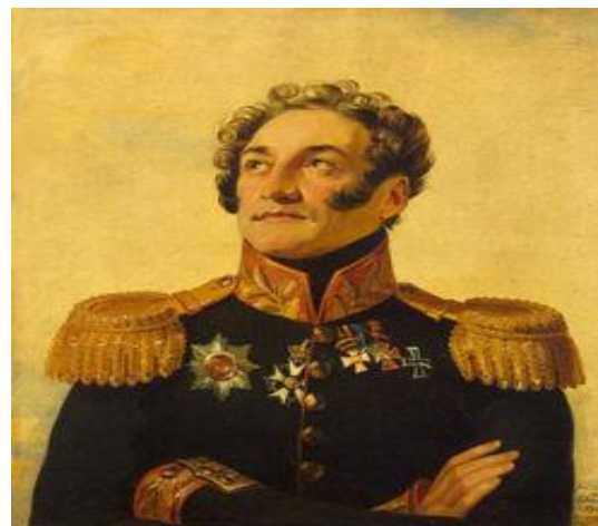
Плато́н Ива́нович Каблуко́в (1779 – 1835) -- генерал-лейтенант, участник войны 1812 года.