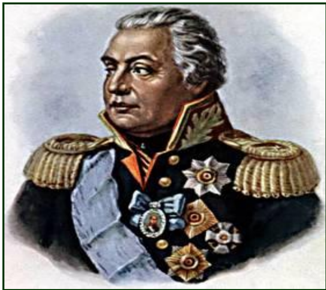
Михаил Илларионович Кутузов