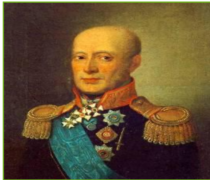
Михаил Богданович Барклай-де-Толли