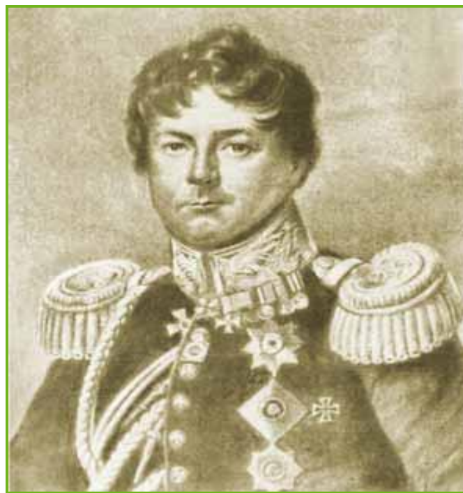
Иван Иванович Дибич-Забалканский