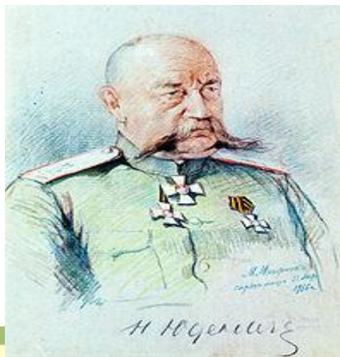
Генерал Н. Н. Юденич