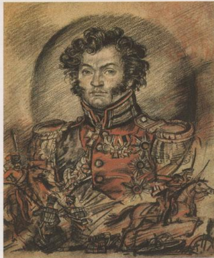
Федор Павлович Уваров 1769—1824

В 27 лет был произведен в генералы. Участвовал в кампаниях 1805—1807 годов и в сражениях на Дунае в 1810 году.