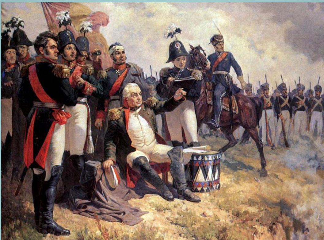
Художник А. Шепелюк. М.И. Кутузов на командном пункте в день Бородинского сражения