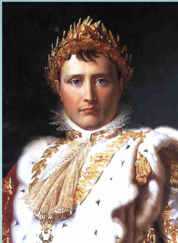
Наполеон Бонапарт, портрет работы Франсуа Жерара