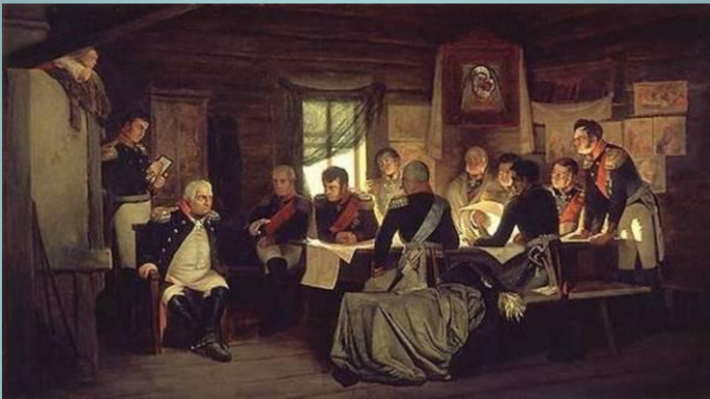
Военный совет в Филях. Художник А.Д. Кившенко. 1880 г.