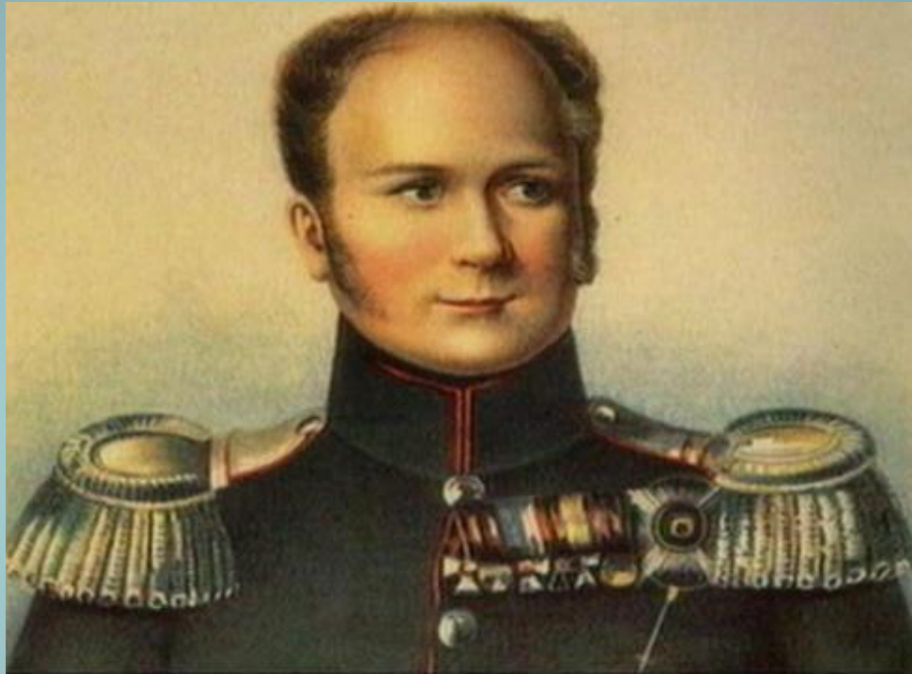
Александр I. Портрет неизвестного художника