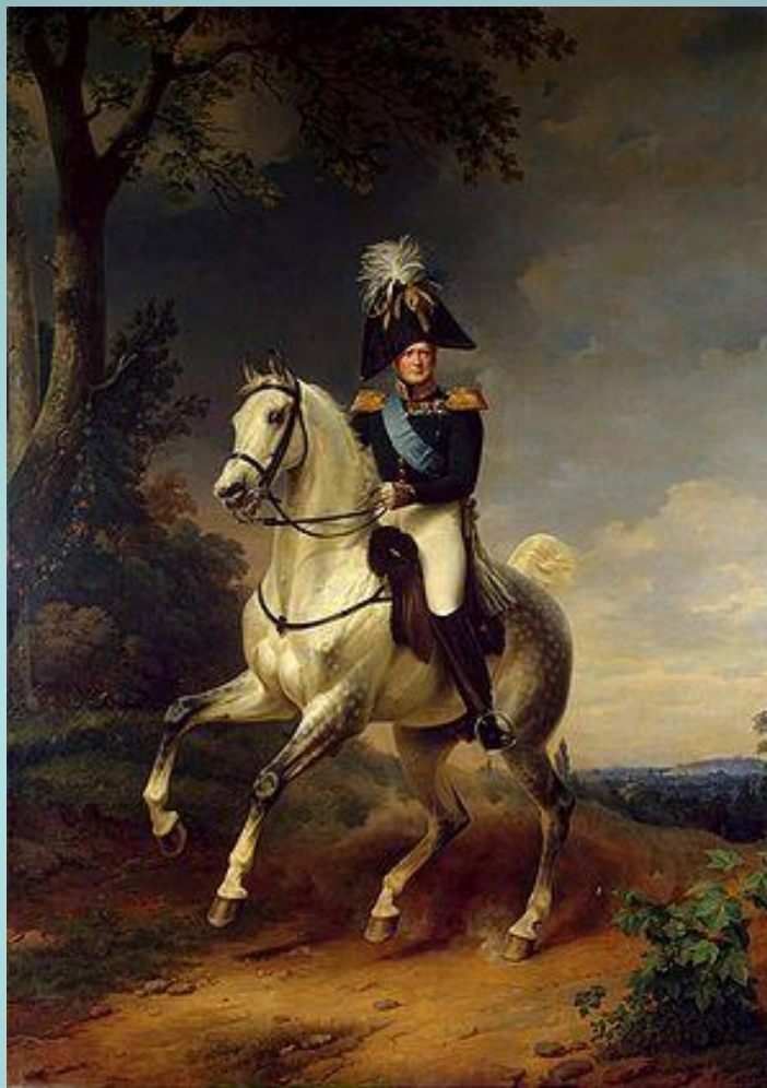
Франц Крюгер. Портрет Александра I верхом на коне.