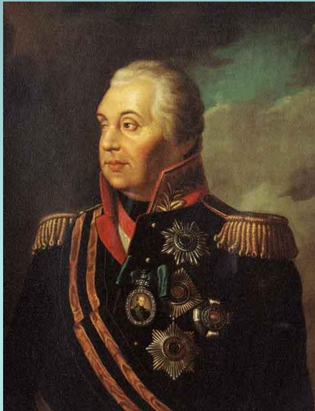
Художник Р. Волков. М.И.Голенищев-Кутузов. 1813 г.