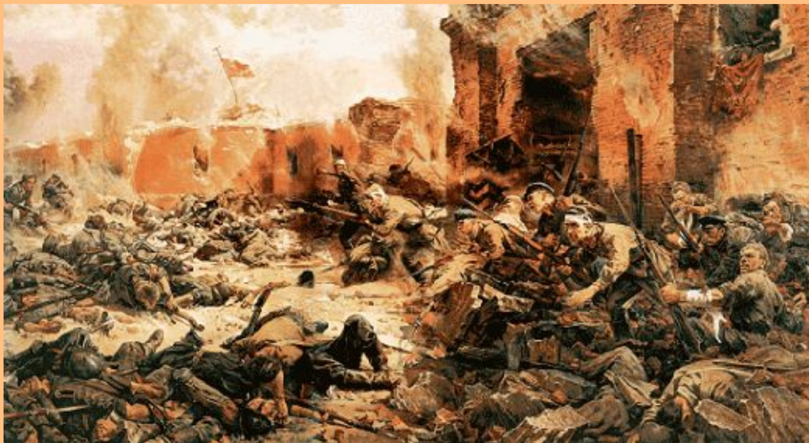
Защитники Брестской крепости. Худ. П. Кривоногов. 1951 г.