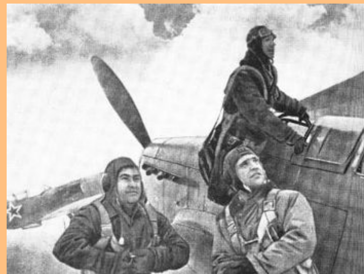
Герой Советского Союза А.П. Маресьев (слева) перед боевым вылетом http://kursk-battle-60.bsu.edu.ru/archives/photoarh/gallery5/photo24.htm