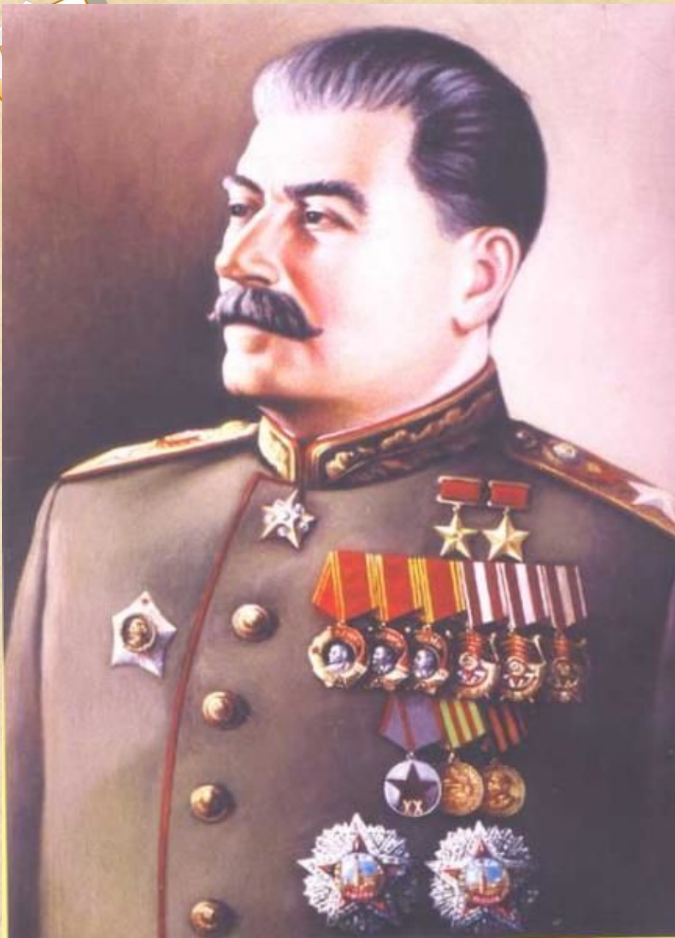
Иосиф Виссарионович Сталин Верховный главнокомандующий Вооруженными силами СССР в годы Великой Отечественной войны