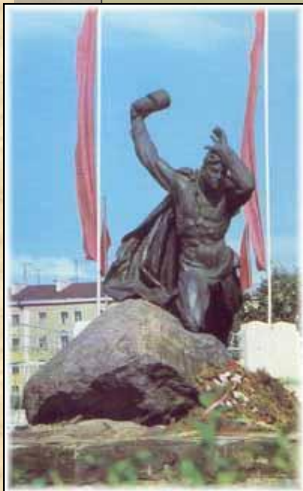
Памятник Анатолию Бредову

Мурманску было присвоено в 1985 году высокое звание - "Город-Герой".