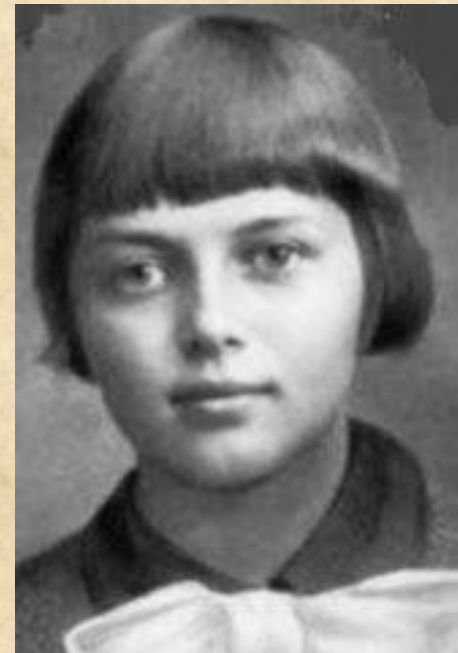
Зоя и Шура Космодемьянские