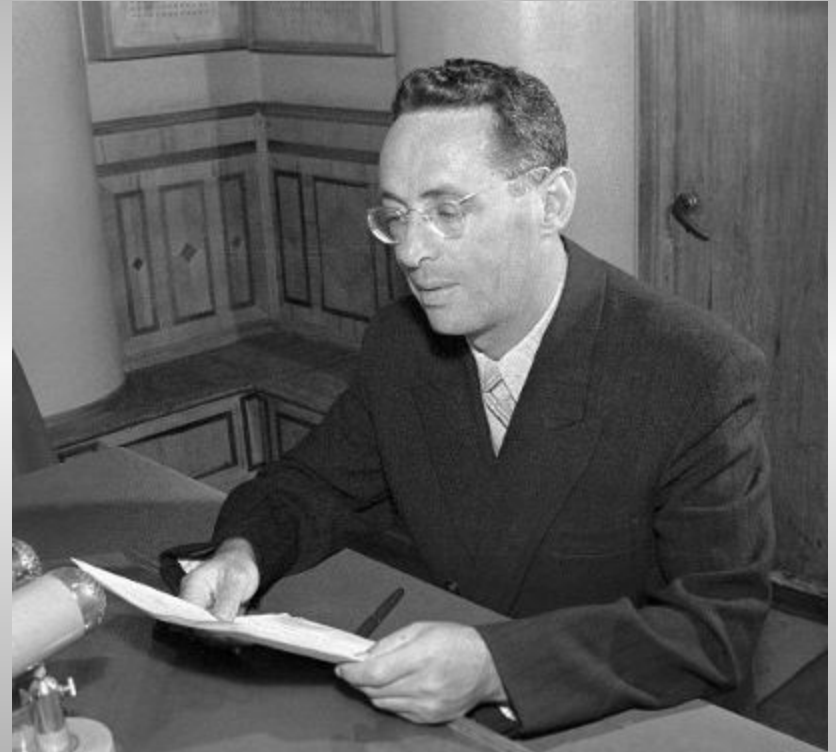
Юрий Борисович Левитан