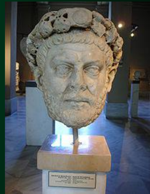
Диоклетиан — римский император

Каппадокия - историческое название местности на востоке Малой Азии на территории современной Турции. Характеризуется чрезвычайно интересным ландшафтом вулканического происхождения, подземными городами, созданными в I тыс. до н. э. и обширными пещерными монастырями, ведущими свою историю со времён ранних христиан.