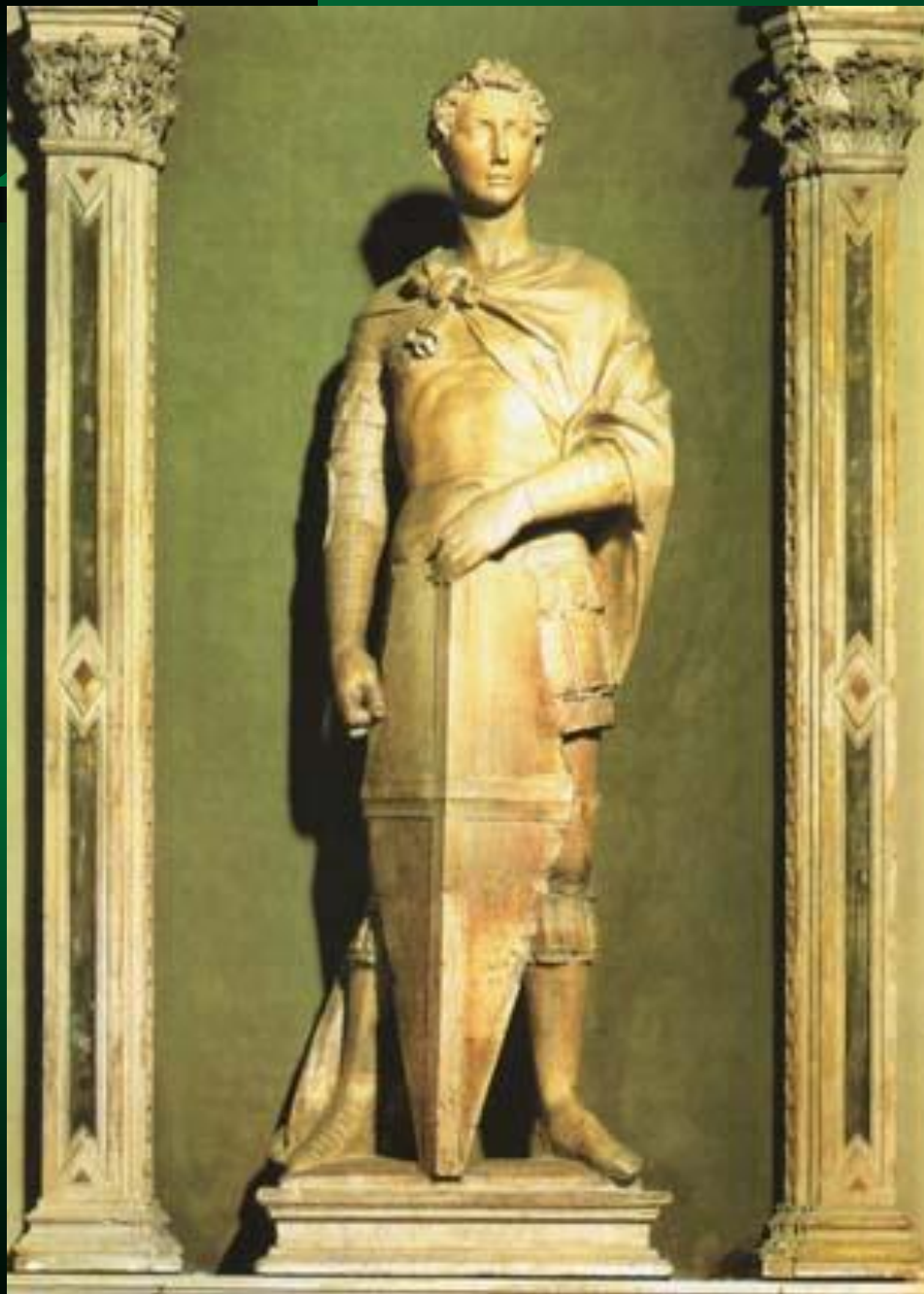
Скульптура св.Георгия (Данателло)