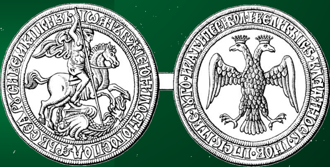
Монеты московских князей

Святой Георгий – идеальный образ воина – защитника Родины.