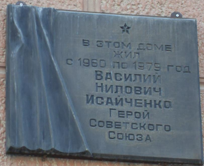
Мемориальная доска по адресу ул. Московская 40