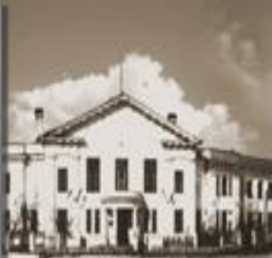
Госпиталь им. Шаумяна в Баку