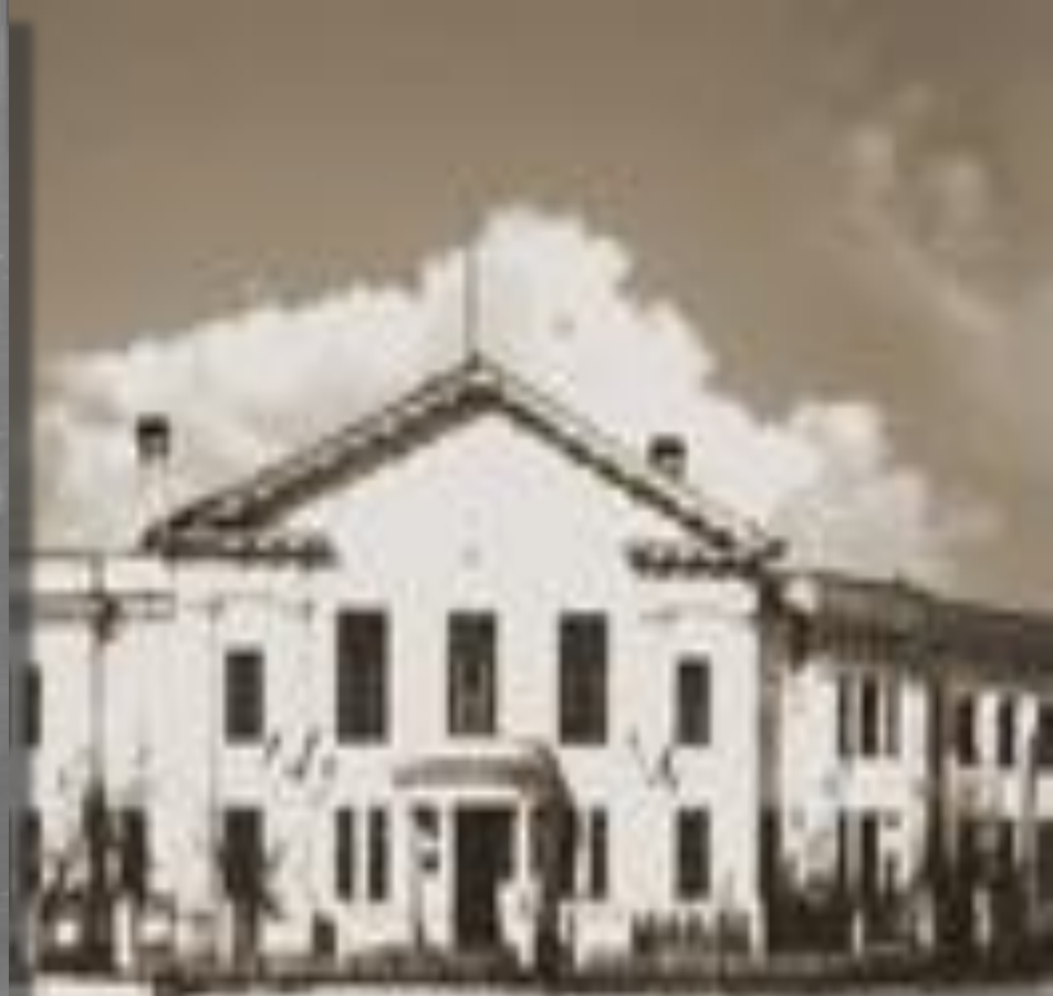
Госпиталь им. Шаумяна в Баку