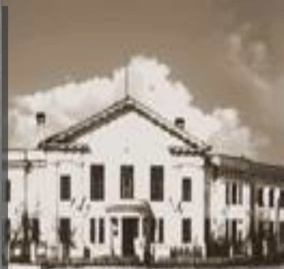
Госпиталь им. Шаумяна в Баку