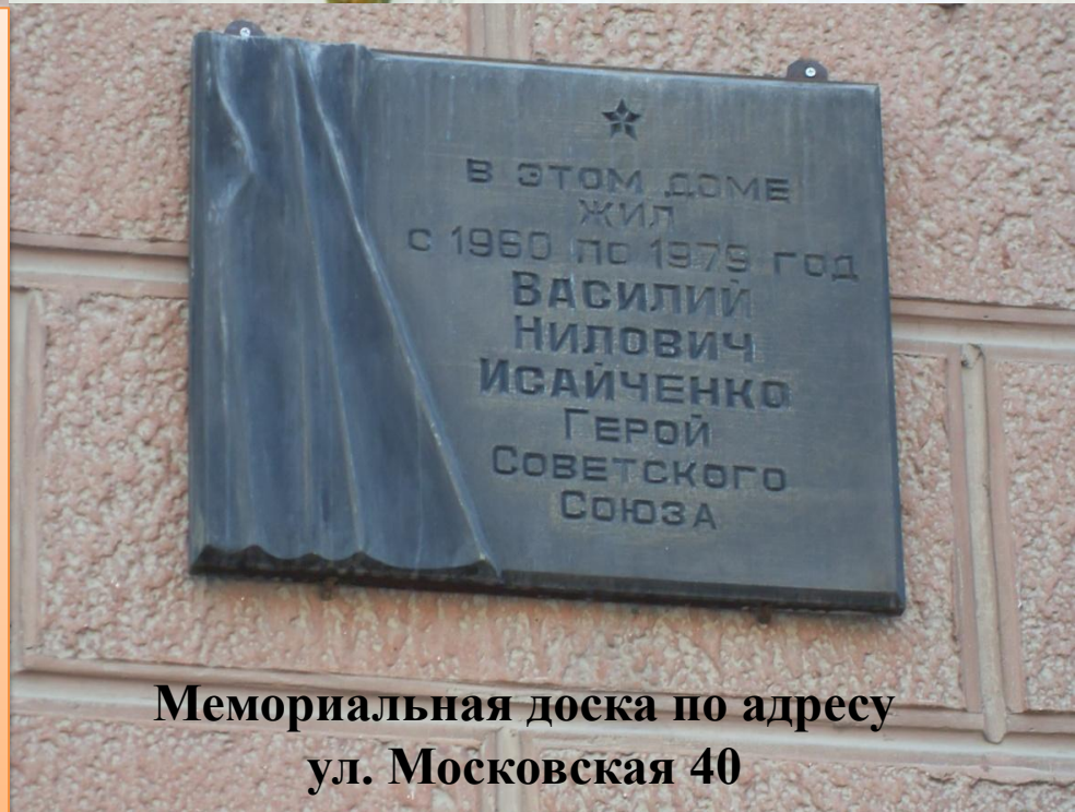
Мемориальная доска по адресу ул. Московская 40

В 2009 году в МОУ «Средняя общеобразовательная школа № 8 г. Юрги» был разработан проект «Память Ваш подвиг хранит», который победил в областном конкурсе социально-значимых проектов. Он предусматривает создание аллеи «Память Героям». На этой аллее будет мемориальная