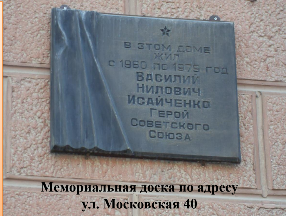
Мемориальная доска по адресу ул. Московская 40

В 2009 году в МОУ «Средняя общеобразовательная школа № 8 г. Юрги» был разработан проект «Память Ваш подвиг хранит», который победил в областном конкурсе социально-значимых проектов. Он предусматривает создание аллеи «Память Героям». На этой аллее будет мемориальная