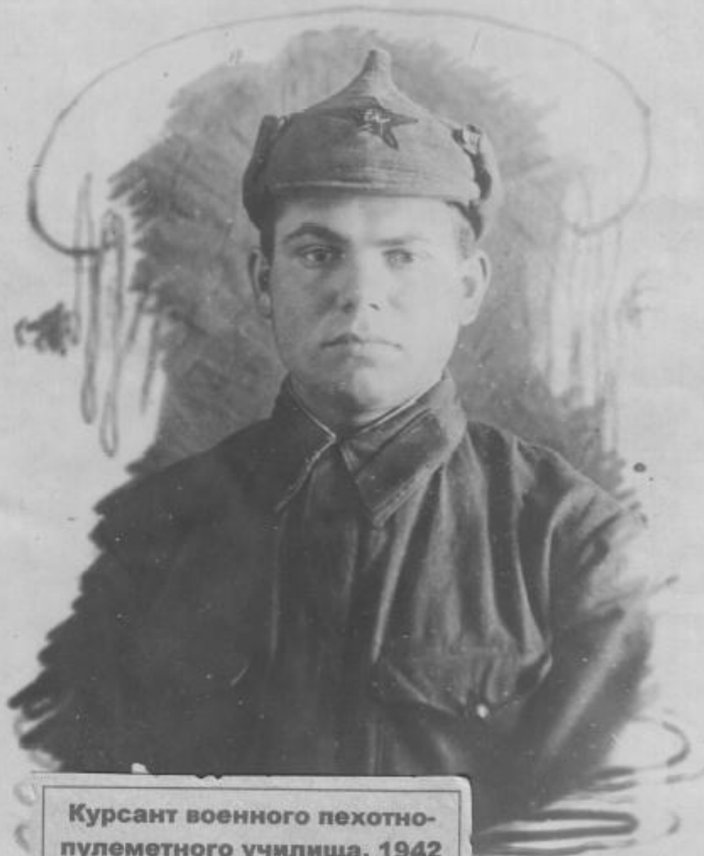
Курсант военного пехотно-пулеметного училища, 1942 г. Комсомольск на Амуре