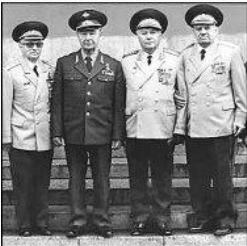
Справа генерал-лейтенант Милицыков Александр Сидорович, второй справа — Маршал Советского Союза, бывший министр обороны СССР Соколов Л.С.