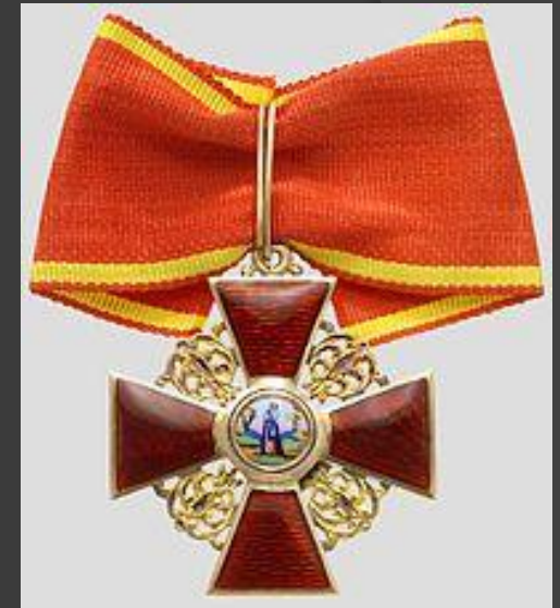
Орден Святой Анны