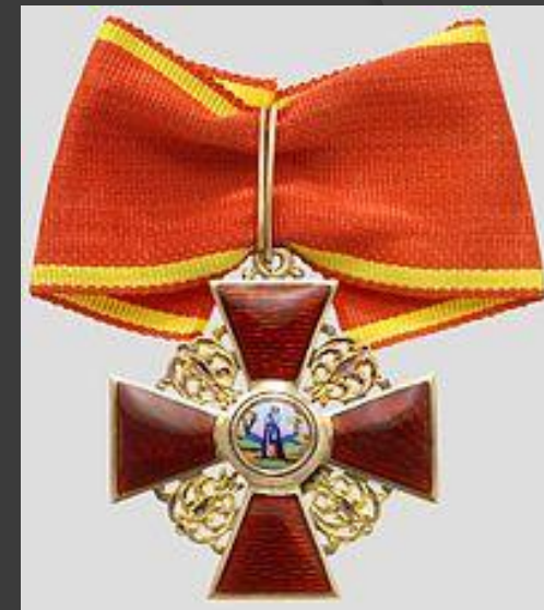
Орден Святой Анны