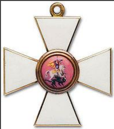
Орден Святого Георгия