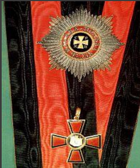
Орден Святого Владимира; Императорский Орден Святого Равноапостольного князя Владимира