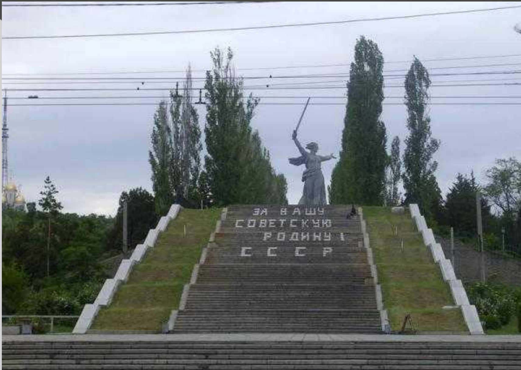
Лестница на Мамаев курган