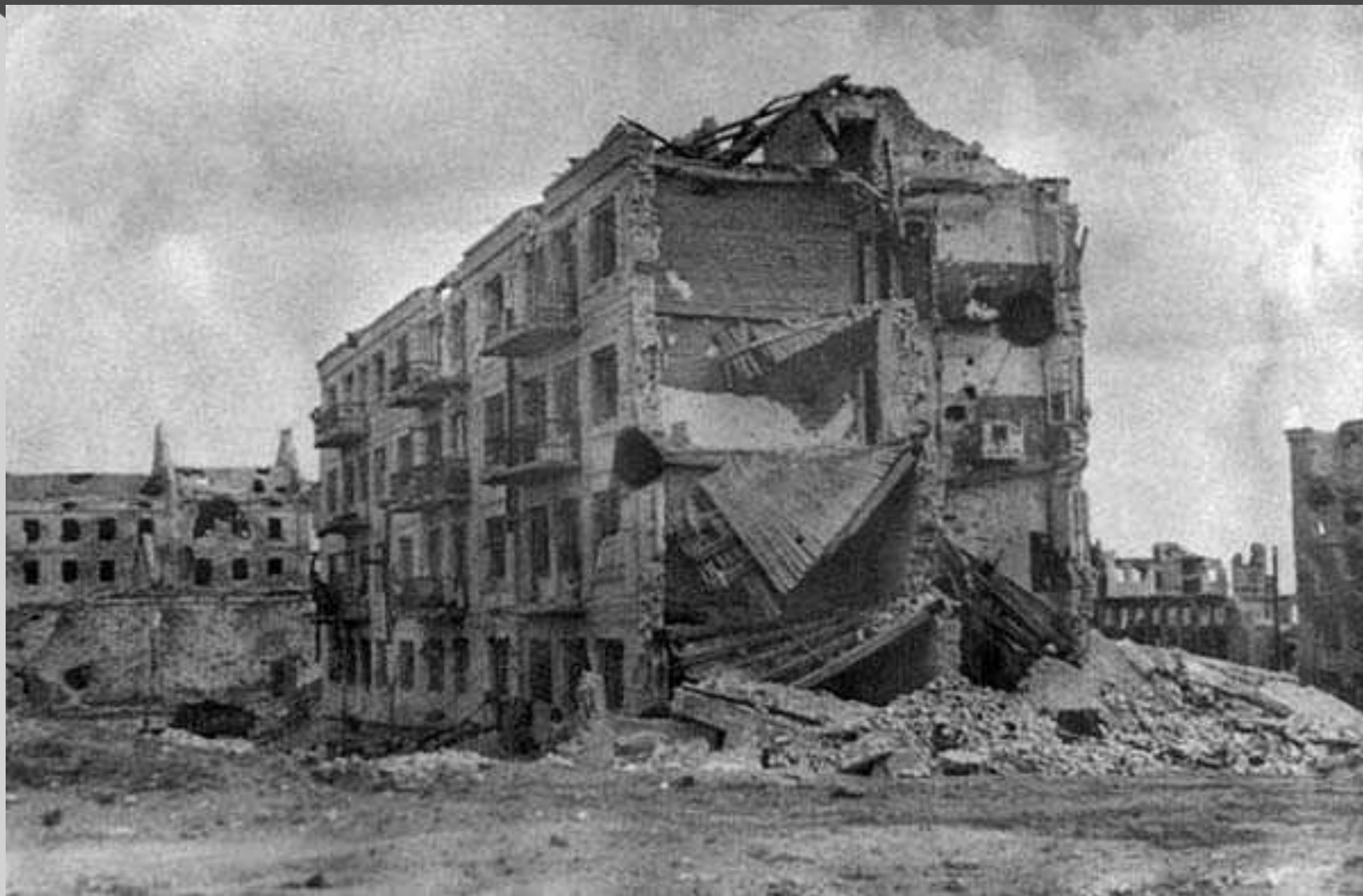
Дом Павлова в Сталинграде