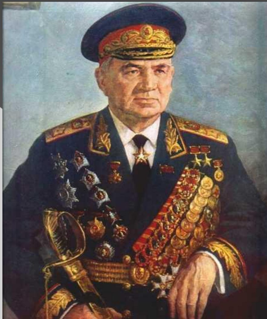
Маршал Советского Союза В.И.Чуйков