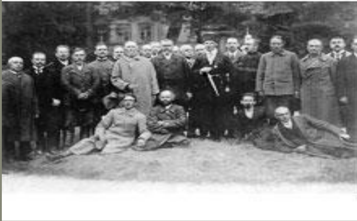
Делегаты Подольской губернии с гетманом всея Украины Павлом Скоропадским на Всеукраинском съезде крестьян-земледельцев. Киев, 29 апреля 1918 г