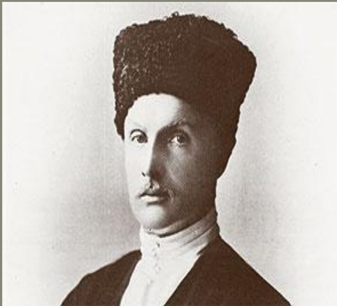
«Ясновельможний Пан Гетьман Української Держави Павло Петрович Скоропадський» - офіціальний портрет его правління