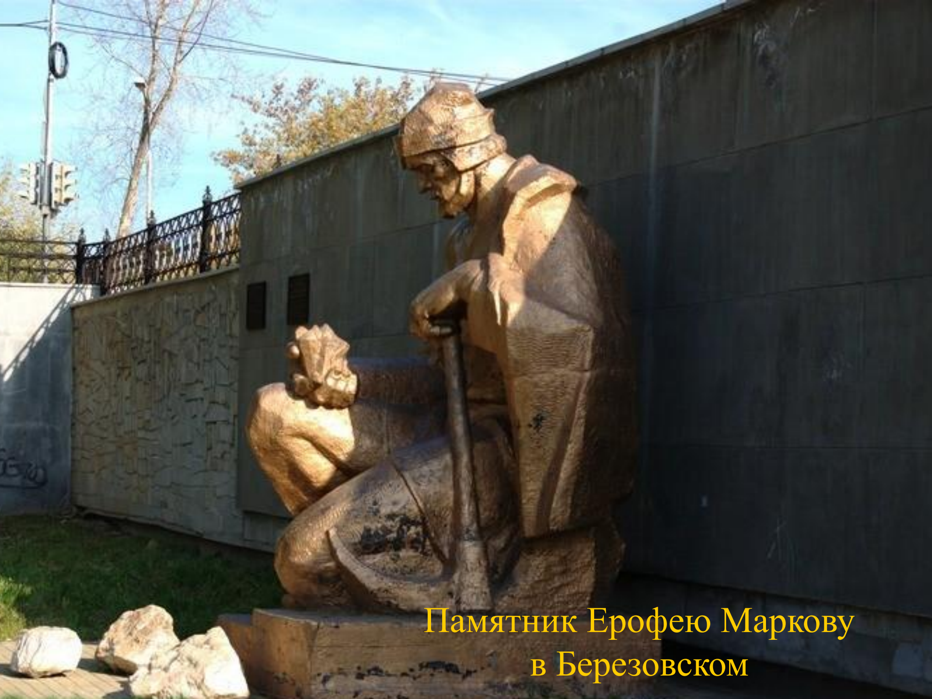
Памятник Ерофею Маркову в Березовском