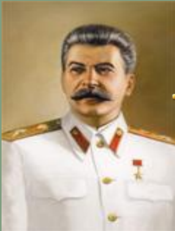
И. В. Сталин