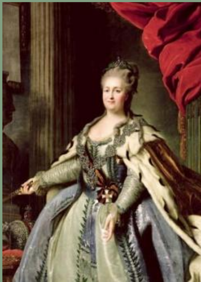
Императрица Екатерина II