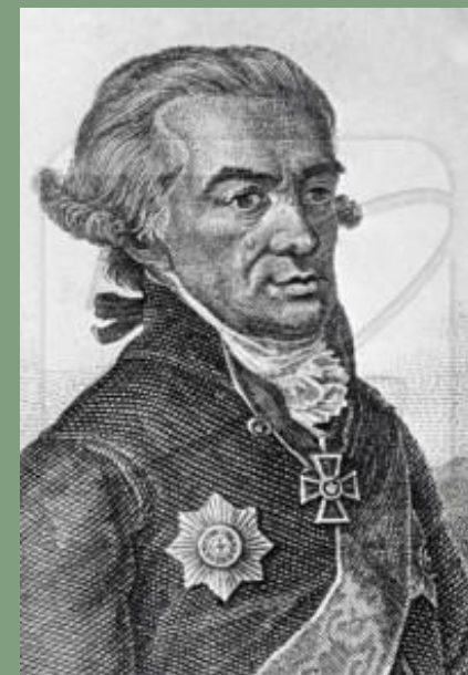
Херасков Михаил Матвеевич