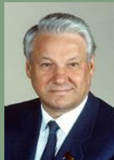
Б. Н. Ельцин