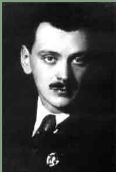
С. В. Михалков