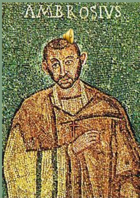
Святитель Амвросий Медиоланский