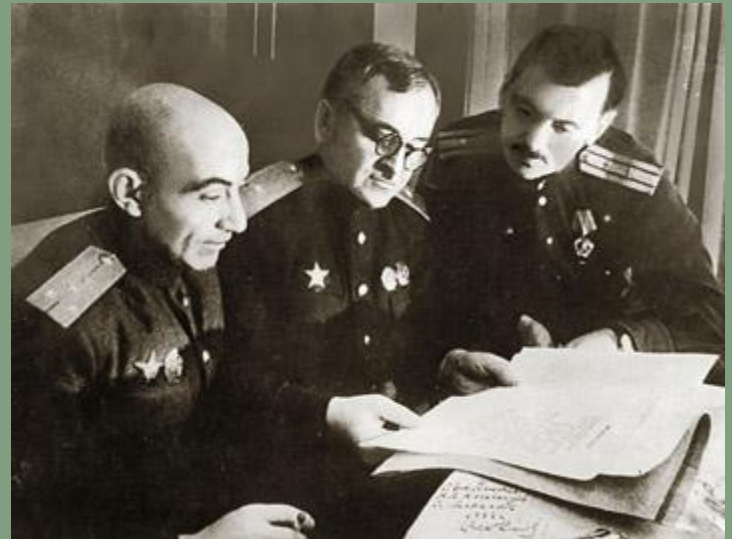
Эль-Регистан, Александров и Михалков