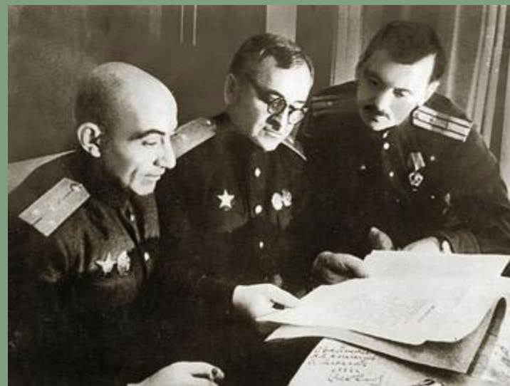
Эль-Регистан, Александров и Михалков