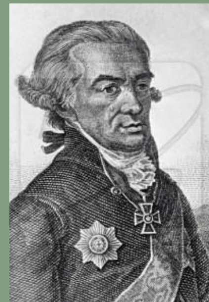
Херасков Михаил Матвеевич