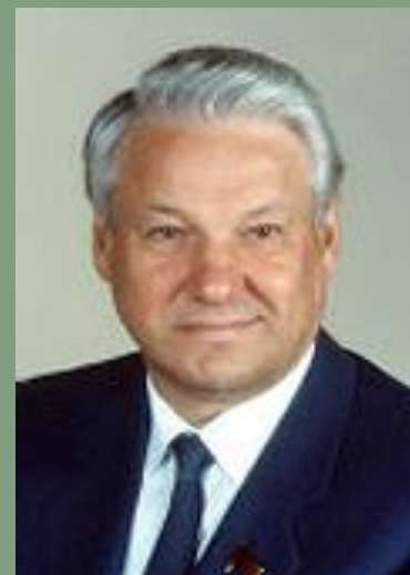
Б. Н. Ельцин