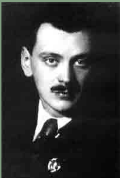
С. В. Михалков