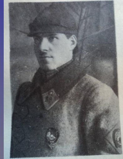
Г. К. Жуков, 1923 г.

Тамбовского восстания, где он познакомился с М. Тухачевским. Молодой командир видел недостаток своего военного образования и поэтому в последующие годы занимался самообразованием, усиленно изучал книги по военному искусству, истории войн прошлого, окончил Высшую кавалерийскую школу в Ленинграде. В 36 лет Г. Жуков командовал уже дивизией, в 40 – конным корпусом. С июля 1938г. Г. К. Жуков стал заместителем командующего войсками Белорусского Особого военного округа по кавалерии. Командовал группой советских войск в Монголии.