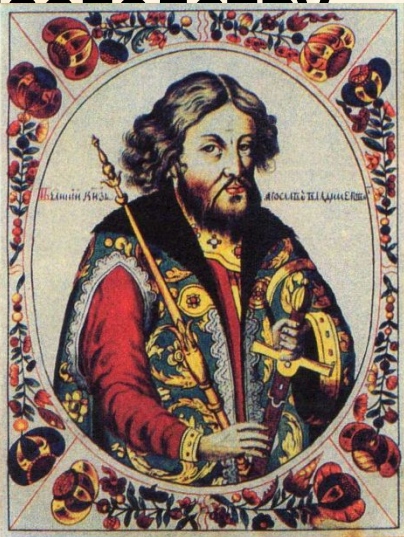
Великий князь Ярослав I Владимирович Мудрый.

Форма правления - монархия это государство, в котором власть передается по