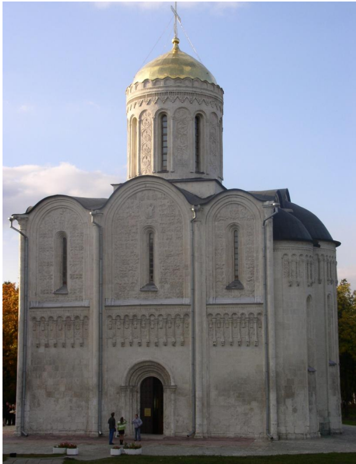
Придворный храм Всеволода

Всеволод III умер 15 апреля 1212 года во Владимире на Клязьме и был погребен в Успенском соборе. Во Владимире-Залесском и в Переяславле-Залесском Всеволод построил новые детинцы, основал Городец на р. Волге. По его приказу в Северо-Восточной Руси был создан ряд каменных церквей и среди них жемчужина русской архитектуры — Дмитриевский собор во Владимире.