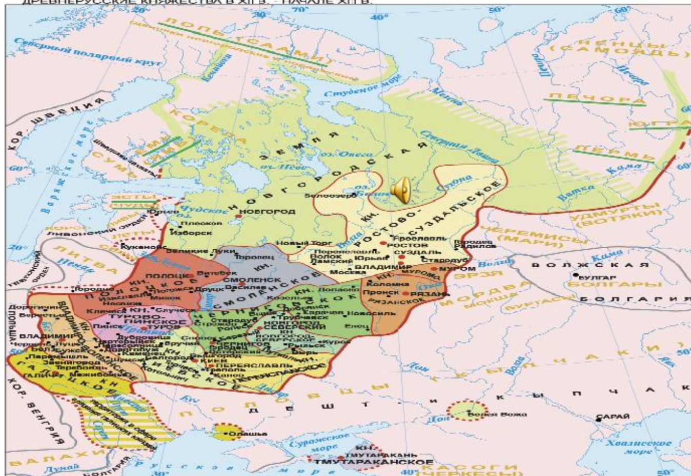
ДРЕВНЕРУССКИЕ КНЯЖЕСТВА В XII В. - НАЧАЛЕ XIII В.