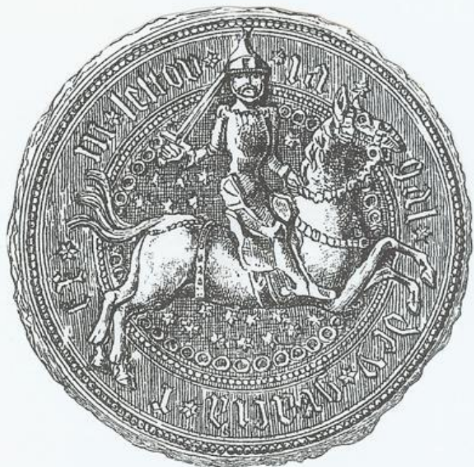
Lietuviškas Jogailos antspaudas