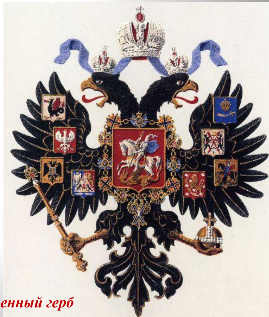
Малый государственный герб