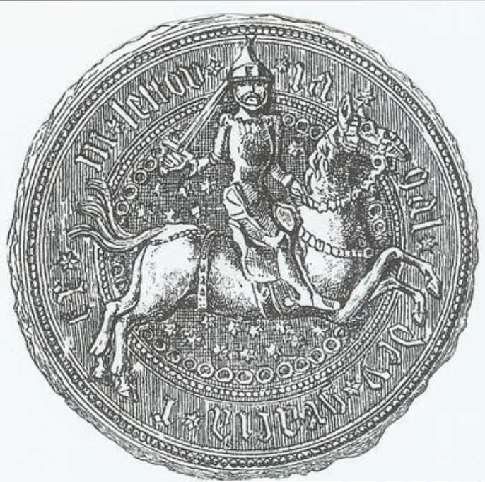
Lietuviškas Jogailos antspaudas