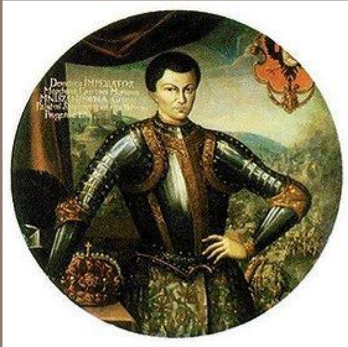
Лжедмитрий I (Дмитрий Иванович)

В 1601г. в Польско-Литовском государстве объявился самозванец, заявивший, что он – «чудом спасшийся» царевич Дмитрий. Это был беглый монах Григорий Отрепьев. Польский король и воевода Мнишек помогли Лжедмитрию собрать войско для похода в Россию.