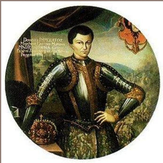
Лжедмитрий I (Дмитрий Иванович)

В 1601г. в Польско-Литовском государстве объявился самозванец, заявивший, что он – «чудом спасшийся» царевич Дмитрий. Это был беглый монах Григорий Отрепьев. Польский король и воевода Мнишек помогли Лжедмитрию собрать войско для похода в Россию.