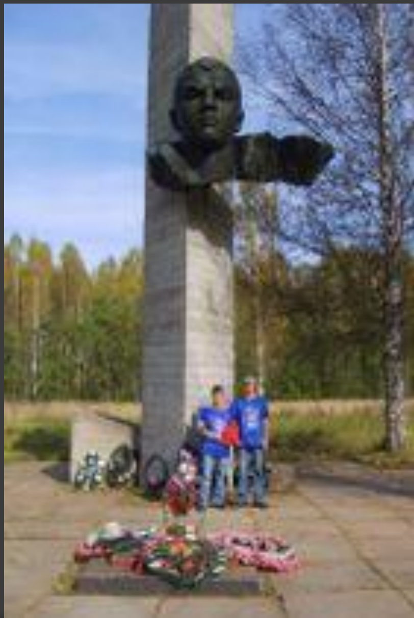
Мемориал Александра Матросова в д. Чернушки