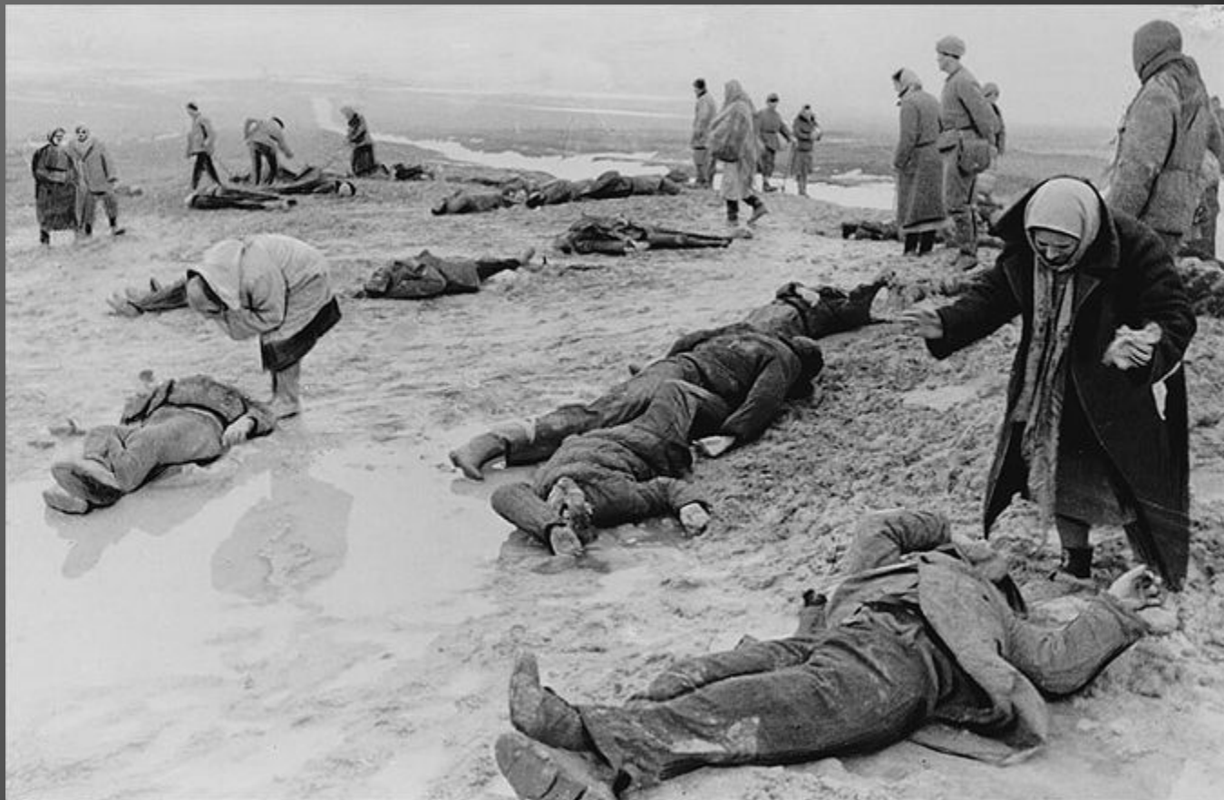
Расстрелянные фашистами мирные советские люди.