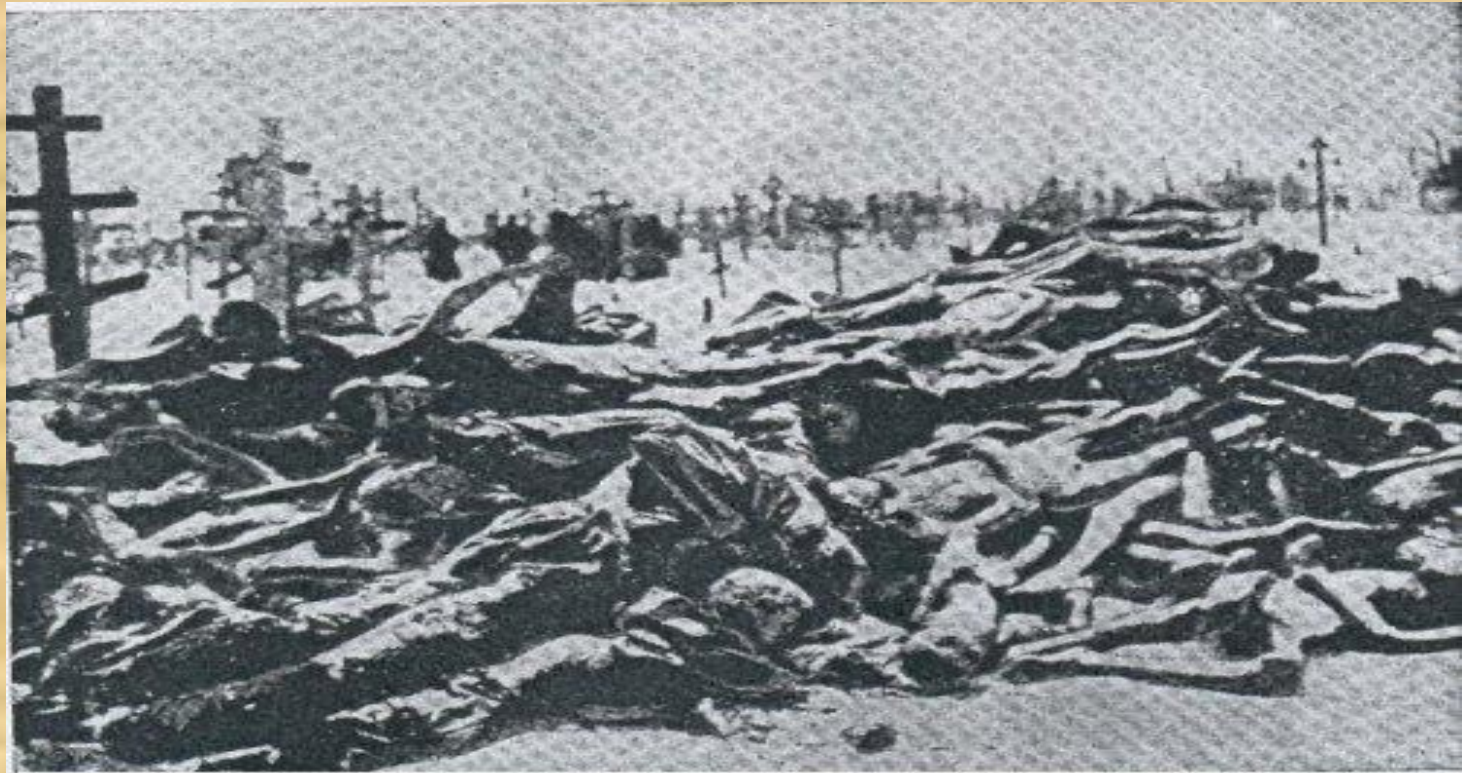
Кладовище в Харкові. Замерзлі трупи українських селян померлих з голоду. 1933 р.

За підсумками судової справи за фактом Голодомору було встановлено, що кількість людських втрат від Голодомору 1932-1933 років складає 3 мільйони 941 тисяча осіб. Втрати українців в частині ненароджених, що за даними слідства СБУ становлять 6 мільйонів 122 тисячі осіб судом не встановлювалися.