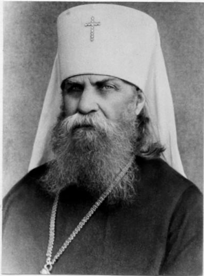
Митрополит Крутицкий Петр Федорович Второй церкви

«ПОЛЯНСКОГО Петра Федоровича, он же митрополит КРУТИЦКИЙ, РАССТРЕЛЯТЬ. Лично принадлежащее имущество КОНФИСКОВАТЬ»