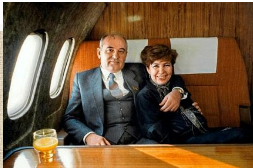
Михаил Горбачёв с женой Раисой