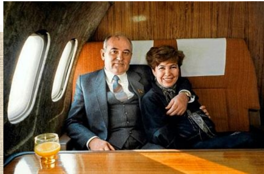
Михаил Горбачёв с женой Раисой