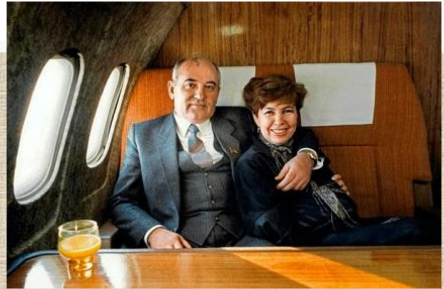
Михаил Горбачёв с женой Раисой