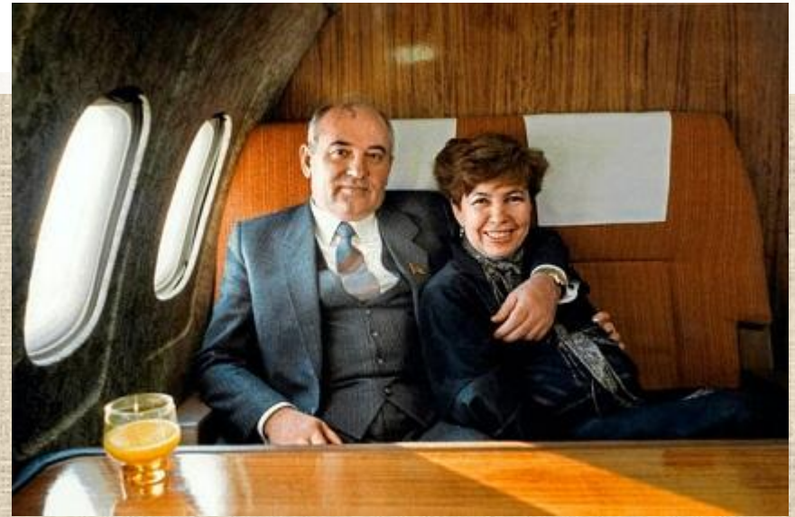
Михаил Горбачёв с женой Раисой