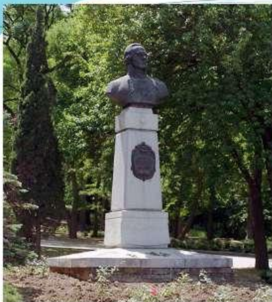
Фото - памятник Ф.Ф. Ушакову