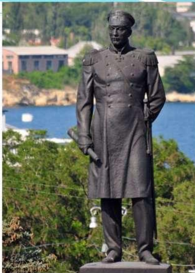
Фото - памятник П. С. Нахимову