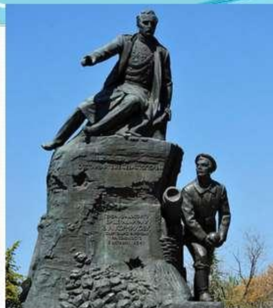
Фото - памятник В. А. Корнилову

Значительное место в истории Севастополя занимают события, связанные с Крымской войной 1854 - 1855 гг. Героическая оборона, доблестные действия моряков флота принесли черноморской твердыне мировую известность и славу. С тех пор Севастополь во все мире известен как Город-герой. Город-легенда. Его история неразрывно связана с историей создания с именами таких выдающихся русских флотоводцев, как Ф. Ф. Ушаков, М. П. Лазарев, В. А. Корнилов, П. С. Нахимов. В честь их заслуг перед Отечеством благодарные потомки воздвигнули памятники.