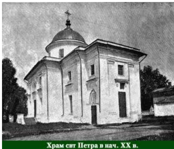
Храм свт Петра в нач. XX в.