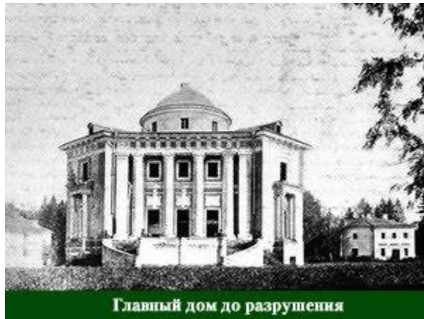
Главный дом до разрушения