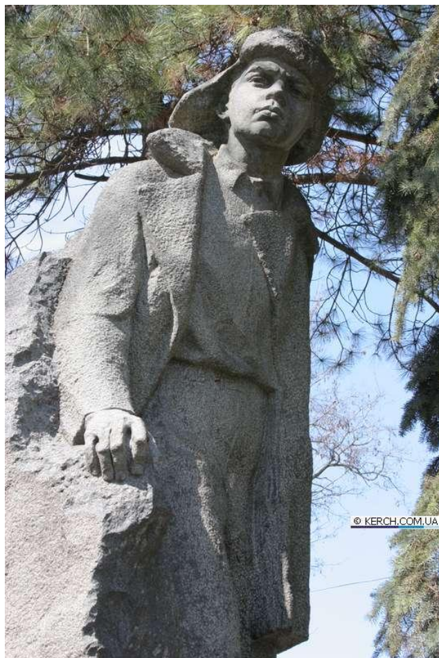
Володя Дубинин (1928 — 1942)