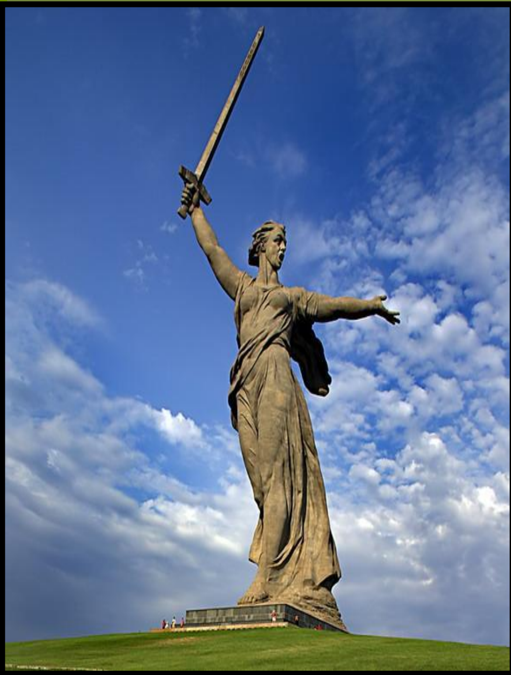
Монумент- скульптура «Родина-мать»