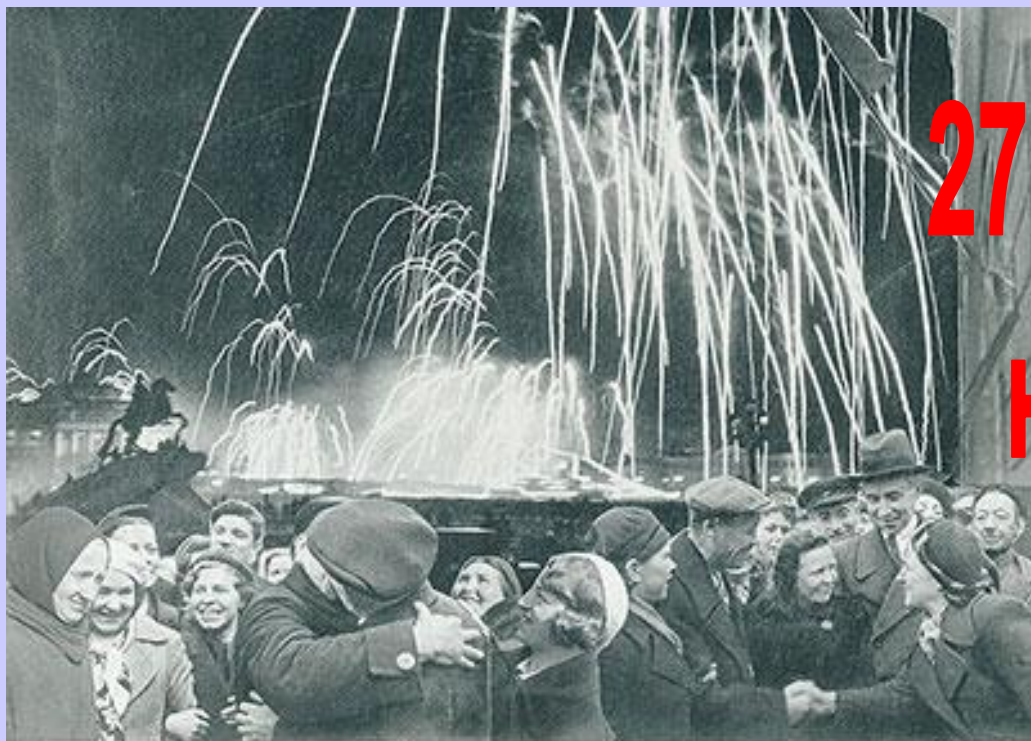
«БЕЛКАЯ ПОВЕДА ОДЕРЖАНА СОВЕТСКИМИ ВОЙСКАМИ ПОД ЛЕНИНГРАДОМ:

27 ноября 1944 года наши защитники сняли блокаду