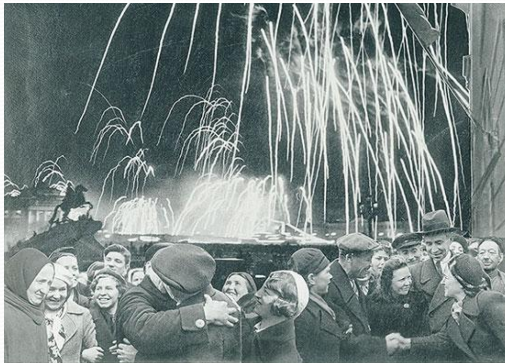
«Великая победа одержана советскими войсками под Ленинградом»

8 мая 1965 года городу Ленинграду было присвоено звание « Города-героя ».